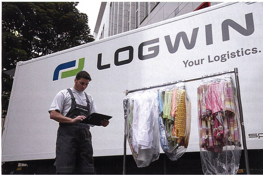
Abb. 2: Distribution: Logwin fashion-x-press

dukte, wie T-Shirts, die in grosser Menge gefertigt werden, werden nach wie vor bündelweise von Nähstation zu Nähstation geführt. Die Grösse der Bündel hängt davon ab, wie viele Lagen Stoff in einem Zuschnitt-Vorgang geschnitten werden. Eine Maximierung durch Kompaktierung der Stofflagen mittels Unterdruck ist seit vielen Jahren üblich. Nach wie vor üblich sind die rollbaren Böcke, auf denen auch grössere Teile wie Hosen, Jacken oder Mäntel durch den Produktionsprozess manuell bewegt werden.