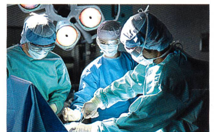
Abb. 1: Stoffe mit «Wohlfühlklima» für den Körper

die Aussenseite transportierte Feuchtigkeit verbleibt zwischen dem OP-Mantel und der Unterbekleidung, da die wasserabweisende Ausrüstung ein «Zurückfließen» der Feuchtigkeit auf die Haut verhindert. Der Chirurg fühlt sich trocken und somit «wohl in seiner Haut» (Abb. 1).