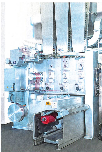
Abb. 2: Die BCF-Anlagengeneration S+

Der führende Anbieter in der Herstellung hoch entwickelter BCF-Teppichgarne zeigt seine technologische Leistungskraft mit der Anlagengeneration S+. Diese BCF-Maschine vereint alle Vorzüge bisheriger Technologien, wie Sytec One oder S5, und bietet zudem eine deutlich höhere Prozessgeschwindigkeit und eine Leistungsfähigkeit von bis zu 99 Prozent (Abb. 2). In der synthetischen Stapelfaser-Herstellung bietet Oerlikon Neumag die Anlage mit der weltweit grössten Kapazität einer einzelnen Linie: Die 300-Tagestonnen-Anlage zur Herstellung von Polyester-Stapelfasern senkt die Betriebs- und Produktionskosten pro Tonne deutlich und ist bereits im Markt platziert. Auf dem Messe-Menü stehen auch Schlüsseltechnologien zur Herstellung von Nonwovens: Der Focus liegt hier auf Anwendungen wie Filtration, Geotextilien und anderen technischen Applikationen.