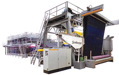
Abb. 7: Die Webmaschine D_LOOP

Die ALPHA 400 Teppichwebmaschinen-Reihe wurde vor vier Jahren auf der ITMA 2007 erstmals der Öffentlichkeit vorgestellt. Mittlerweile hat die Maschine ihre Eigenschaften erfolgreich bewiesen und produziert bei vielen Kunden Teppiche, Läufer und Auslegeware für den Heimtextil-, Objekt- und Transportbereich. Die ALPHA 400, die in fünf Konfigurationen zur Verfügung steht, produziert Teppiche in ausgezeichneter Qualität und mit beeindruckenden Dessins bei ausserordentlich hohen Produktionsgeschwindigkeiten.