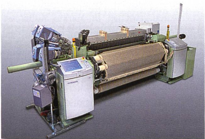
Abb. 4: DOB-Gewebe auf einer Greiferwebmaschine Typ PTS8/S 20 C in 190 cm MNB

Das Herz der Greiferwebmaschine ist der bewährte DORNIER Schusseintrag mit positiv gesteuerter Mittenübergabe. Zuverlässig und präzise wird der Schussfaden aufgenommen, übergeben und bis zur Abbindung im Offenfach sicher gehalten. Durch den Einsatz der hochdynamischen Streichbaumeinrichtung (DWG) wird auch bei hochschäftigen, komplexen Artikeln ein optimaler Spannungsausgleich der Fäden ermöglicht. Der flexible Eintrag von sehr dünnen bis zu größten Schussgarnen pic-à-pic wird anhand eines Bekleidungsstoffes der Alta Moda gezeigt (Abb. 4).