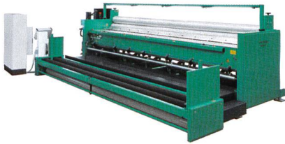
Abb. 1.: Gesamtansicht der Nähwirkmaschine MALIVLIES

die Montage und Inbetriebnahme sowie den Service und die Ersatzteilversorgung. Auch bei der Produktentwicklung wird das Unternehmen den Kunden zur Seite stehen. Damit ist der nahtlose Transfer der Malimo-Technologie gesichert.