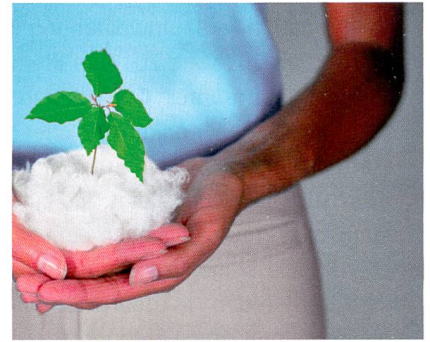
Abb. 2: Nachhaltigkeit in der Lenzing Gruppe, Quelle: Lenzing Aktiengesellschaft

Im Kerngeschäft Fasern ist im vierten Quartal mit einem durchschnittlichen Preisniveau etwa auf dem Niveau des dritten Quartals sowie Vollausslastung der Faserproduktionskapazitäten zu rechnen. Auf