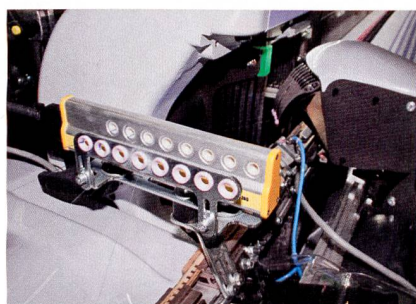
Abb. 1: Der Maestro-Schussfadenwächter an der Greiferwebmaschine Silver 501

Während der ITMA 2011 in Barcelona wurde der Maestro-Schussfadenwächter an der neuen Greiferwebmaschine Silver 501 vorgestellt. Anders als die Wächtereinrichtungen der Mitbewerber verwendet Maestro eine spezielle Einheit, die die Signale von jeder Öse zum Mikroprozessor der