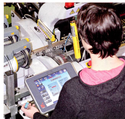
Abb. 2: Der Touch-Screen erlaubt dem Weber und dem Techniker die Silver 501 sehr einfach zu bedienen

Bei konventionellen Schussfadenwächtersystemen müssen Empfindlichkeit des Messsystems und der Überwachungsbereiches genau definiert sein. Mit dem Maestro-System werden die beiden