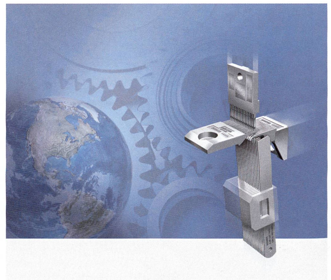
Abb. 1: Prozesssicherheit durch funktionales Zusammenspiel