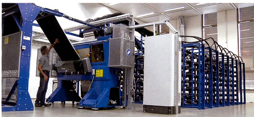
Abb. 2: Tufting-Maschine

Unsere weltweite vertriebliche Präsenz wird zusätzlich durch unseren einzigartigen Tufting Onlinekatalog unterstützt. Dieser Katalog hilft Ihnen bei der Auswahl der für Sie optimal passenden Gauge Parts und informiert gleichzeitig über Produktspezifikationen und andere wissenswerte Einzelheiten.