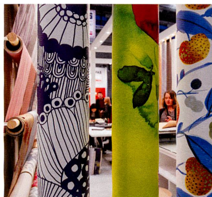
Abb. 6: Tapete – das innovative Einrichtungselement

Die Farbskalen bei Teppichen sind umfangreich. Bei einem hohen Flor werden oft dickere Fäden mit dünneren Garnen gemischt. Häufiges Motiv: Farbige Karos oder Rhomben. Als Neuheit sah man auf der Heimtextil Teppichfliesen in freien Formen, die man auf dem Boden zu