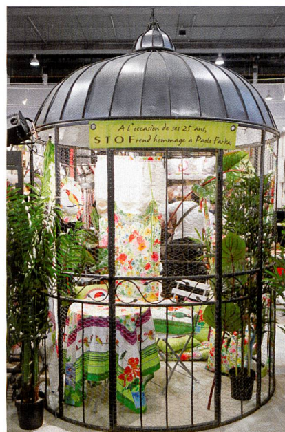
Abb. 2: Florale Dekors, Quelle: Messe Frankfurt Exhibition GmbH/Thomas Fedra

Oft wechseln sich matte und glänzende Musterpartien ab. Bei den Bezugstoffen zeigte die Heimtextil viele uni-ähnliche Dekore. Gerade hier werden vor allem der Gebrauchstüchtigkeit wegen diverse Garnfasern gekonnt gemischt. Viele Bezugstoffe haben handwerklich anmutende, traditionelle Muster. Dank ihrer kräftigen Farben wirken sie jedoch durchaus zeitgemäss.