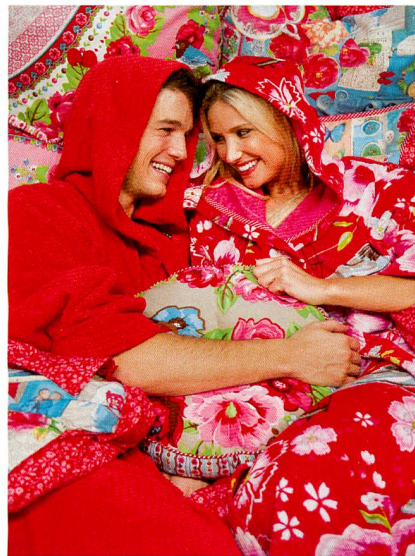
Abb. 5: Farbenfrohe Frottierwaren, Quelle: Messe Frankfurt Exhibition GmbH/Petra Welzel

Sie hat sich zum innovativen Einrichtungselement gemauert: die Tapete. Ihre Erfolgskurve auf der Heimtextil steigt und steigt: Kein Wunder, mit ihr lässt sich die Atmosphäre eines Raums ohne allzu grossen Aufwand eindrucksvoll beeinflussen und verändern. Auf der Heimtextil brillierten die