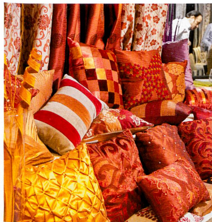
Abb. 1: Ausdrucksvolle Farben, Quelle: Messe Frankfurt Exhibition GmbH/Jean-Luc Valentin

Je eleganter der Stoff, desto dunkler die Farben, die dann jedoch durch den subtilen Glanz des Materials oder durch eingewebte Effektgarne aufgehellt werden und dezent schimmern. Weiterhin beliebt: Naturnahe Farbkombinationen wie Braun, Greige und Beige oder der Farbkontrast Schwarz und Weiss, der zumeist für Stoffe