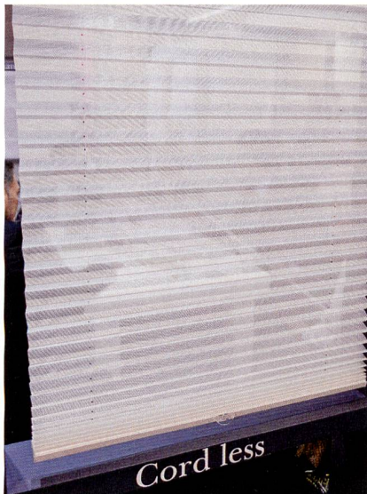
Abb. 4: Neues bei Rollos

renten und blickdichten Streifen, mit dem man den Licht- und Sichtschutz besonders fein justieren kann. Rollos lassen sich jetzt auch auf Fensterflügeln montieren. Die neuen Jalousien kann man variabel vor dem Fenster hoch und herunter schieben (Abb. 4).