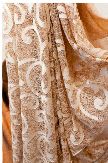
Abb. 3: Durchbruchmuster, Quelle: Messe Frankfurt Exhibition GmbH/Jean-Luc Valentin

Stark im Kommen: Kunstleder in hunderterlei Farben, als Echtleder-Imitation oder mit modernen, grafischen Prägungen.