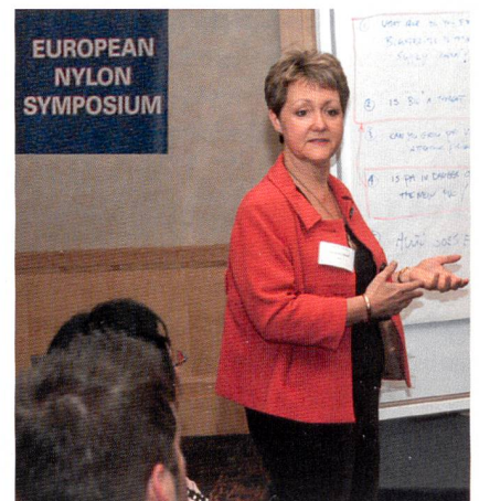
Abb. 2: Round-Table-Gespräche am zweiten Tag des Symposiums