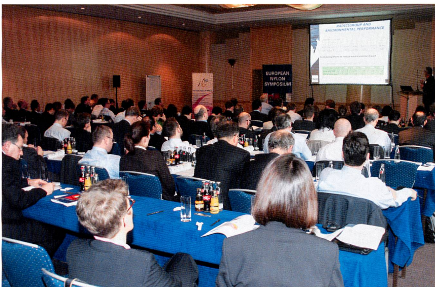
Abb. 1: Mit über 100 Teilnehmer aus dem west- und osteuropäischen Wirtschaftsraum war das European Nylon Symposium 2012 ein voller Erfolg

Einhelliger Tenor auf der Veranstaltung war, dass Polyamid aufgrund seiner exzellenten Werkstoffeigenschaften, wie hohe Festigkeit, Steifigkeit und Zähigkeit, den langjährigen Erfolgsweg sicherlich fortsetzt. Ein Hemmschuh könnte allerdings das momentan hohe Preisniveau sein. Der weltweite Verbrauch von aktuell insgesamt 6,4 Mio. Tonnen (PA6 und PA66 zusammen) kann in den nächsten Jahren um durchschnittlich 2,4 % pro Jahr wachsen, so die derzeitige Prognose (Abb. 3). Dieser Zuwachs stützt sich allerdings vorrangig auf den überdurchschnittlichen steigenden Bedarf an technischen Kunststoffen. Das hat zur Folge, dass der PA-Verbrauch für die Herstellung von Fasern bis 2020 weltweit auf einen Anteil unter 50 % sinken kann (in Europa sogar auf lediglich rd. 30 %). Zum Vergleich: Im Jahr 2000 gingen weltweit noch gut 70 % der gesamten PA-Produktion in die Faserherstellung.