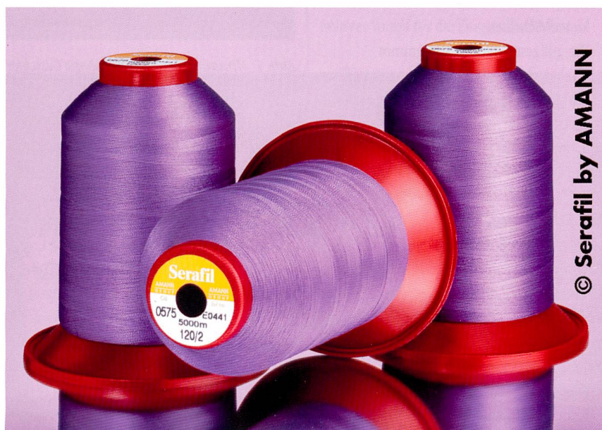
Abb. 3: Das Stickgarn Serafil

Die Sticknadel ist der letzte Baustein von grosser Bedeutung auf dem Weg zur gelungenen kleinen Schrift. Je feiner die Nadel, desto genauer können die Konturen eingehalten werden und desto geringer ist das Risiko einer Materialbeschädigung durch dicht nebeneinander liegende Einstichlöcher. Mit einem Faden der Stärke 75 kann im Extremfall sogar mit einer Nm 55 Nadel gestickt werden. Damit sind – unter der Voraussetzung, dass die anderen Parameter in Ordnung