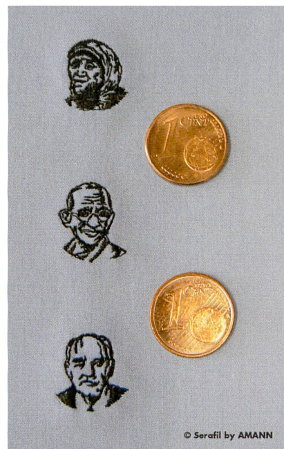
Abb. 1: Miniaturstickerei – berühmte Gesichter