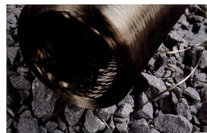
Abb. 2: Roving aus Basalt