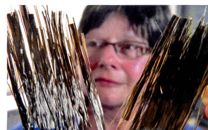
Abb. 3: Beim Vliesstoff-Hersteller Norafin in Mildena laufen erste Versuche mit Basaltfasern