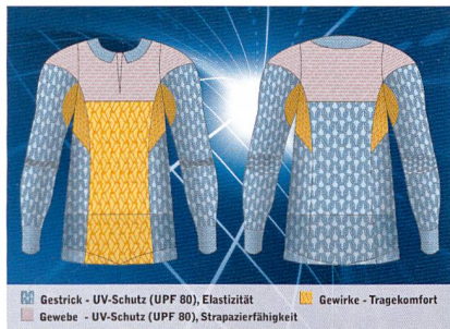
Abb. 4: Comfort-Mapping