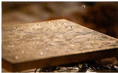
Abb. 6: Messplatte des Hautmodells

einem aktuellen Forschungsprojekt. In einer speziell entwickelten Stressbox mussten Probanden mit hoher Konzentration eine anspruchsvolle Aufgabe erfüllen. Dabei trugen sie Bekleidung von unterschiedlicher Qualität. Im Anschluss an die Stressphase wurde die mentale Leistungsfähigkeit der Probanden mit einem neuen Software-Testsystem geprüft, welches internationale Standards der Arbeitspsychologie beinhaltet. Getestet wurde sowohl die ungeteilte Konzentration als auch die Fähigkeit der Testpersonen zum Multitasking.