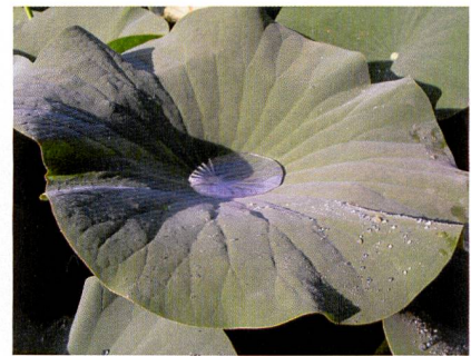
Abb. 1: Die von der Lotuspflanze bekannte schmutzabweisende Wirkung kann auch für Bekleidung genutzt werden

Eine weitere Möglichkeit der Nutzung von Nanopartikeln ist die Ausstattung von Materialien mit Silber. Die antimikrobielle Wirkung von Silber ist schon seit Jahrhunderten bekannt und wird unter anderem auch für die Trinkwasseraufbereitung genutzt. Es kann in die Fasern eingebunden oder auf diese aufgedampft werden. Die elektrisch geladenen Teilchen (Ionen) des Silbers wirken dabei gegen eine Vielzahl von Mikroorganismen