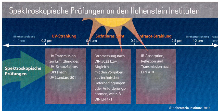
Abb. 3: Spektroskopische Prüfungen

Bei ITO handelt es sich um transparente Halbleiter, die z. B. auch in Touchscreens von Smartphones zum Einsatz kommen. Die Herausforderung für die Forscher besteht darin, die ITO-Partikel so mit den Textilien zu verbinden, dass deren sonstige Eigenschaften wie der physiologische Komfort nicht negativ beeinflusst werden. Zudem muss die Beständigkeit der textilen Ausrüstung gegenüber Waschen, Scheuern und Bewitterung sichergestellt werden.