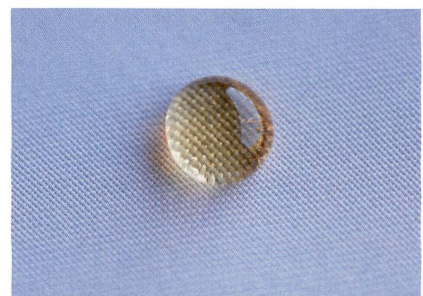
Abb. 2: Nano-funktionalisierte Textilien weisen Wasser und Schmutz ab

und können so die Übertragung von Krankheitserregern durch Textilien oder auch die Vermehrung (Schweiss-)Geruch produzierender Keime verhindern. Moderne Untersuchungsmethoden erlauben es heute sogar, die Wirkung von Textilien gegenüber Geruchsbildnern und die Bindung von Geruchsmolekülen an die Fasern quantitativ zu erfassen.