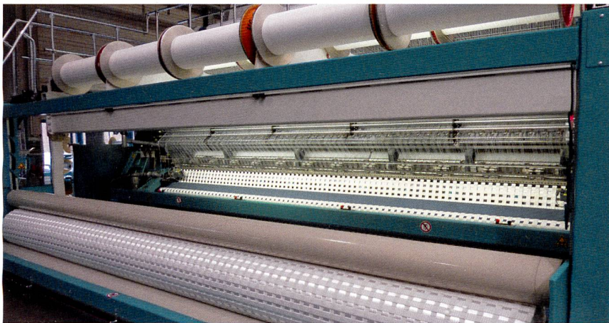
Abb. 1: Die RS MSUS-V bei der Produktion der starken Geogitter

Geotextilien sind flächenhafte und durchlässige Textilien. Sie dienen als Baustoff im Bereich des Tief-, Wasser- und Verkehrswegebau und sind für geotechnische Sicherungsarbeiten ein wichtiges Hilfsmittel. Geotextilien bestehen entweder aus natürlichen Rohstoffen oder Chemiefasern und werden zum Trennen, Dränen (Drainage), Filtern, Bewehren, Schützen, Verpacken und als Erosionsschutz eingesetzt. Geotextilien kommen in Form von Geweben, Gewirken, Vliesstoffen und Verbundstoffen zum Einsatz. Gewirkte Geogitter mit einer bisher unerreichten Zugfestigkeit sind beispielsweise für den Einsatz im Bergbau geeignet.