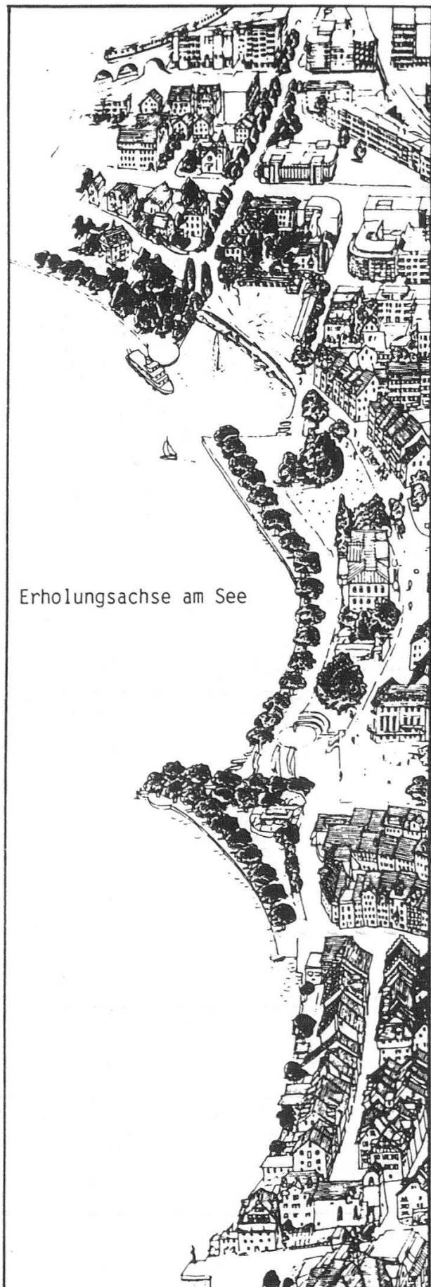
Erholungsachse am See

mehr in dieser Uferzone Gebäude zu errichten. Anstelle der bisherigen Privatgrundstücke wurden öffentliche Quaianlagen von 60 m Breite mit Promenade, Alleen, Wiesen und Bäumen gestaltet. Mit Ausnahme der 100 m breiten Abbruchstelle ist die 400 m lange Quaianlage fertig erstellt worden 3 . Das heutige Erscheinungsbild mit den strengen Kastanien-, Maulbeer- und Platanenalleen entlang der Quaimauer und den frei gestalteten rückwärtigen Grünanlagen ist nun etwa 100 Jahre alt (Abb. 2).