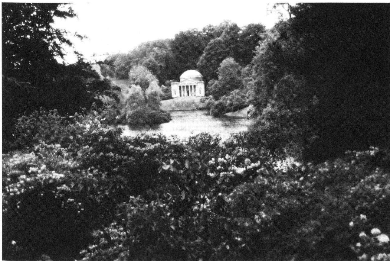
Parc romantique de Stourhead, Wiltshire: Tableau – Surprise sur le Panthéon.

P.s. Toute personne désirant visiter ou avoir des précisions sur ces jardins peut contacter l'auteur: G. Biaggi, Av. Charles-Secrétan 25, 1005 Lausanne.