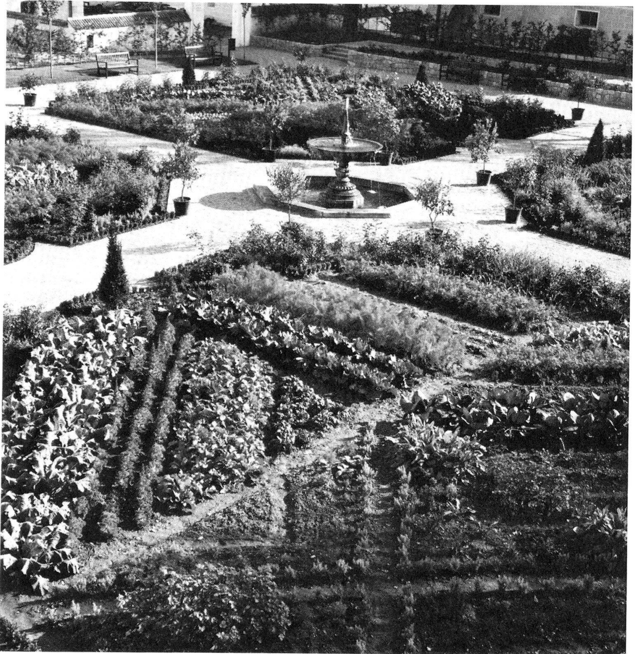
Ansicht des Gartens von Nordwesten, im Vordergrund ein Beet mit Gemüse- und Kräuterbepflanzung, Aufnahme Herbst 1991, unmittelbar nach Abschluss der Rekonstruktion.