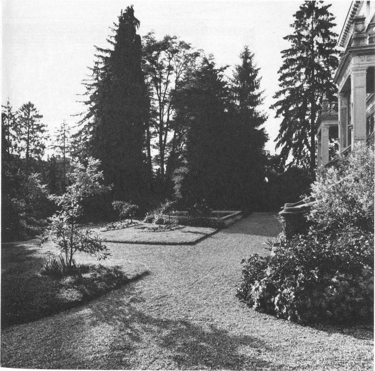
Villanaher Bereich des Patumbah-Parkes. 1986 – 92 vom Gartenbauamt Zürich saniert.