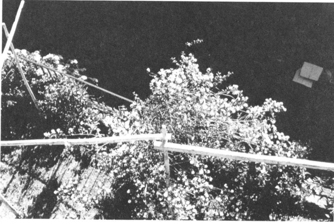
Des terrasses qui s'enchâtignent.