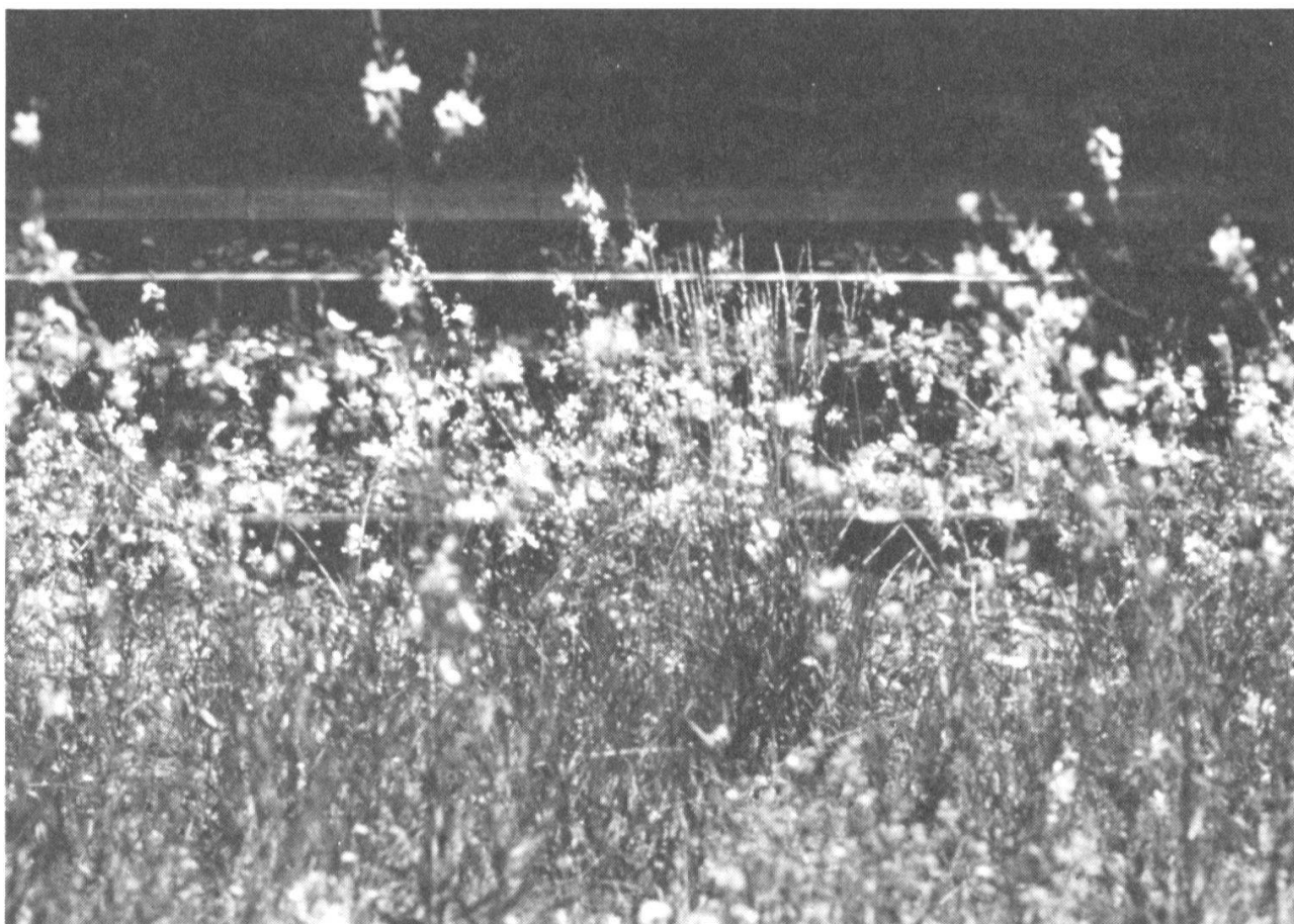
La ficelle.