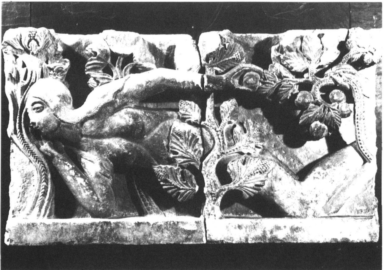
La tentation d'Eve (XII e siècle) Autun – Musée Rolin