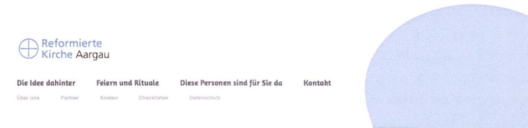
Abb. 5. Startseite der Ritualplattform Leben-feiern .

sich inhaltlich. Thut adressiert die Lesenden und bewirbt ihre Dienstleistung, Pfeiffer nennt seine Vorlieben und Hobbies und Blumer nennt die Potentiale «gottesdienstlicher Rituale». Während Ritualbegleitende auf dem freien Markt darum bemüht sind, ihre Qualifikation und Funktion deutlich zu kommunizieren, indem sie sich als «zertifizierte Zeremonienleiterin», «Freie Rednerin» oder «Freie Theologin» anpreisen 11 , bleibt hier die Qualifikation der drei Personen unbestimmt. Ihre Versiertheit und ihr Charisma müssen wir ihnen glauben. Die uneinheitliche Textgattung wirkt zudem etwas disparat. Dass es sich hier um drei Pfarrpersonen handelt, wird nicht gesagt.