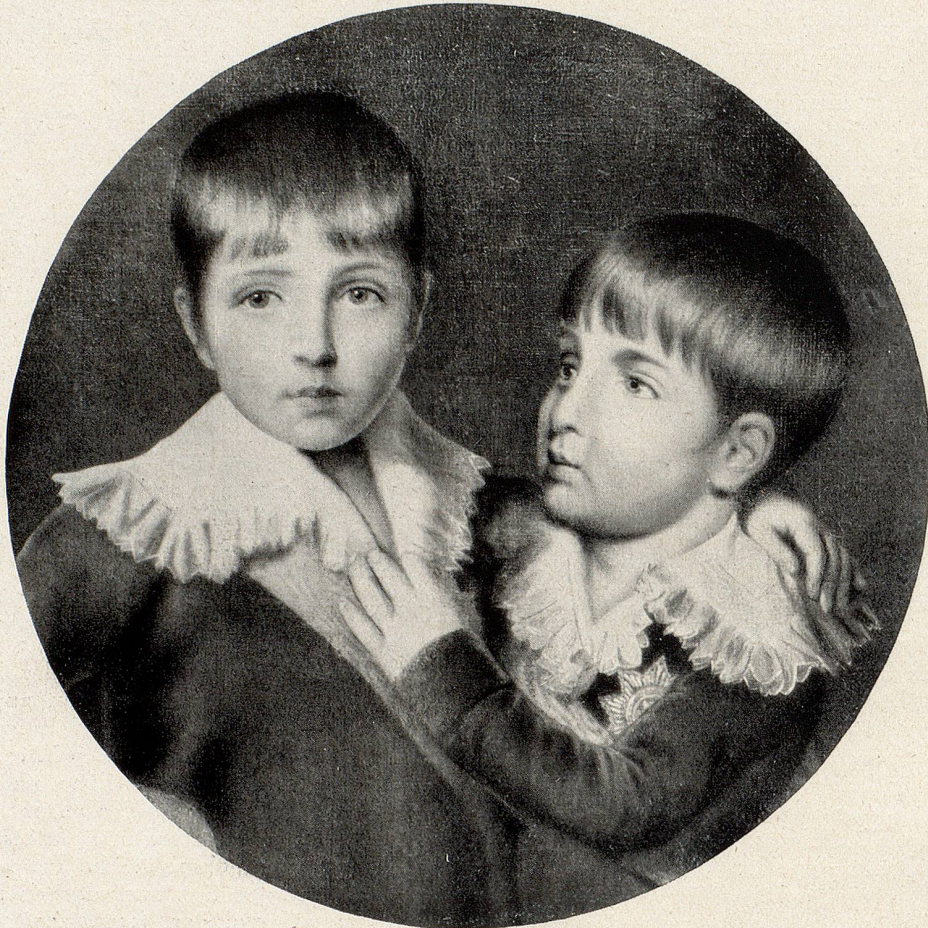
Napoleon Louis und Louis Napoleon Nach einem Gemälde im Museum Arenenberg

Am 5. Juni 1806 wurde Hortensens Gemahl von Napoleon zum Herrscher des neugeschaffenen Königreichs Holland ernannt und so mussten er und