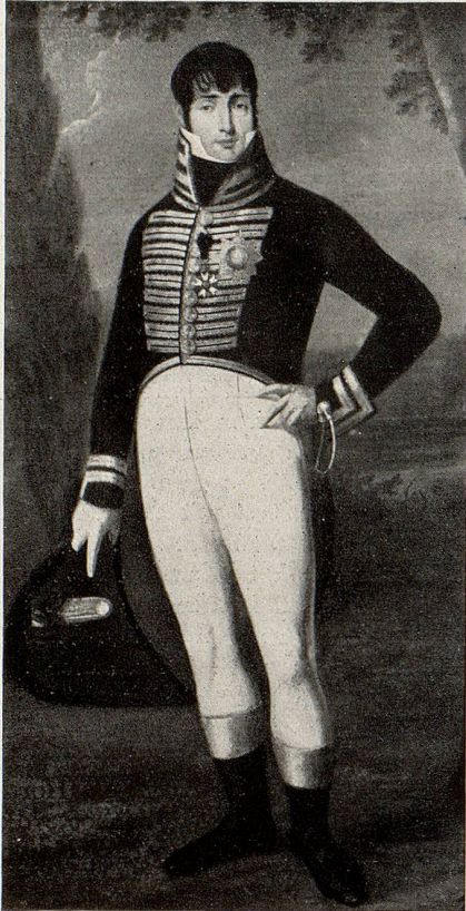
König Louis von Holland Nach einem Gemälde von J. B. Scheffer im Museum Arenenberg

Unaufhörlich wurde nun die Königin von ihrem Gatten, der sich inzwischen in Graz niedergelassen hatte, gedrängt, ihm den Prinzen Napoleon Louis dorthin zu senden. Sie aber vermochte sich nicht von ihren Kindern zu trennen. Da forderte der König sein Recht durch die Gerichte und er erreichte, was er wollte. Nach einem langen, lebhaften Prozess wurde ihm am 7. März 1814 sein