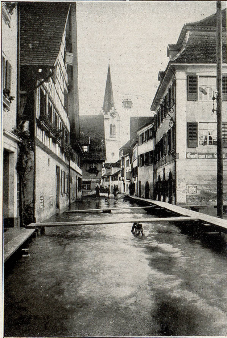
Berlingen in Wassernot.

In Berlingen wohnt ein derber Volksschlag. Sorgsam hütet er heute noch die Sitten der Väter. Aber gerade die Liebe zum Altväterischen macht ihn sympathisch und lässt manch harten Auswuchs am Stamme dieses naturwahren Baumes übersehen. Mann und Frau, Jüngling und Tochter teilen sich in diese Urwüchsigkeit. Sie bilden als Ganzes «etwas für sich». Da hat der Lippenstift noch keine Heimstatt und nur die der Natur abgelassene Bodenständigkeit herrscht. Der «Hof der Hortense» auf dem nahen Arenenberg hatte keinen Einfluss auf die Sitten der Berlinger ausgeübt, und darum ist's im Verkehr mit den Leuten oft, als wäre man für einen Augenblick in die gute alte Zeit zurückversetzt und wären grosse Zeitepochen zurück überschlagen, zurück in die Tage der Napoleonisten, da sie sich am Untersee heimisch fühlten und in deren Kreis Napoleon III. seinen Putsch vorbereitete. Nirgends wird den modernen Neuerungen ein kritischerer Empfang bereitet als hier. Der Kampf um den Erwerb aus der fruchtbaren Scholle, aus des Sees reichen Schätzen ist der Leute angeborener Pflichtkreis, in den hinein nur wenige gelegentliche Dorffeste die Sonnenfülle über eine einsame Oase streuen. Ja, diese Dorffeste! Sie bedeuten dem Völklein mehr als die nationalen Feiertage, und es hatte die Antwort jenes Schülers auf die Frage, welches