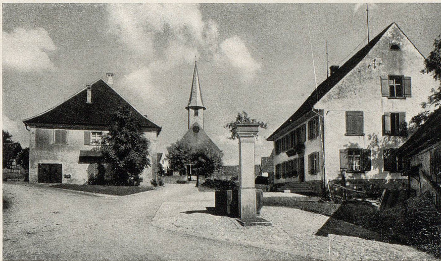
Kirchplatz von Hüttwilen.

Ein Herbsttag, der mich ins gastliche Hüttwilertälchen führte, hat mir unverwischbare Eindrücke eingegraben. Klar, von allem Sommerdunst der Ferne abgerückt, lag die kleine, stille Welt um das scharf in Ober- und Unterdorf zergliederte Hüttwilen. Der verbleichende Sonneglast eines warmen Septembertages senkte