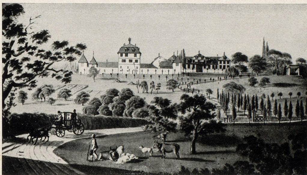
Schloss Wolfsberg (ca. 1830) nach einem zeitgenössischen Aquarell im Schloss Wolfsberg.

Charleville zur Welt, wo ihr Vater ein angesehenes Mitglied des Rates der Stadt war und es später während der Revolution zum Deputierten der konstituierenden Versammlung brachte. Nach der Schreckensherrschaft kam sie in das von Madame Campan, der geistvollen Vorleserin der Königin Marie Antoinette, eröffnete Institut. Dort traf sie neben vielen Schülerinnen, die später in der Gesellschaft des Konsulates und des ersten Kaiserreiches eine bedeutende Rolle spielten, auch die Tochter der verwitweten Josephine Beauharnais, Hortense, die im gleichen Alter stand wie sie. Die auf diese Art entstandene Bekanntschaft artete bald in intime Freundschaft aus, und als Hortense durch die Wiederverehelichung ihrer