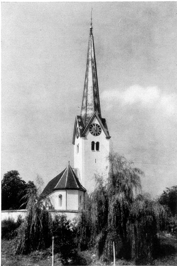
Die Kirche in Affeltrangen nach der Renovation

Voll Sehnsucht erwartete das ganze Dorf den 8. Dezember 1934, den Tag des Glockeneinzuges. Als ich um halb 11 Uhr jenes denkwürdigen Tages auf den Bahnhof kam, umringten schon viele Leute den Eisenbahnwagen, auf dem unsere vier neuen Glocken standen. Ich war ganz erstaunt über die Größe und Schönheit des Geläutes, welches das Weihnachtsgeschenk des ganzen Dorfes werden sollte. Auch die Sonne, die endlich den dicken Nebel durchdringen konnte, wollte sehen, wie die schweren