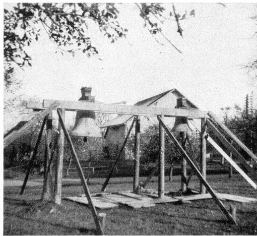
Die beiden kleinen alten Glocken auf ihrem Holzgerüst

Glocken auf die bereitstehenden Wagen geladen wurden. Liebkosend berührten ihre wärmenden Strahlen die metallenen Mäntel der Glocken und die frohen Gesichter der Zuschauer. Gegen Mittag thronten die schweren Kolosse schon auf den Wagen. Sinnige Frauenhände bekränzten die Glocken mit dunkelgrünem Efeu, mit roten, weißen und gelben Winterastern. Der Anblick des Geläutes war jetzt geradezu eine Pracht.