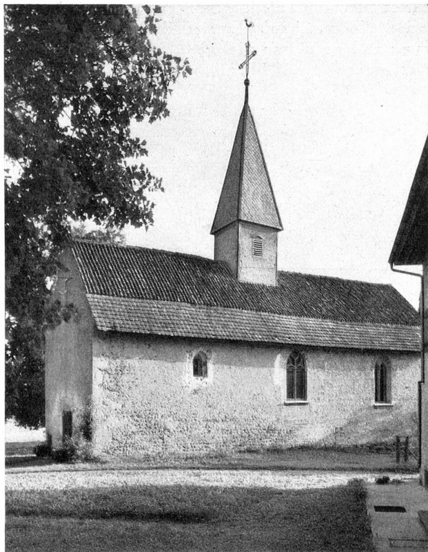
St. Leonhardskapelle in Landschlacht von Süden Links der älteste Teil mit kleinem, romanischem Fenster Eine zweite romanische Luzida in der Mitte ist durch ein größeres spätgotisches Fenster ersetzt worden