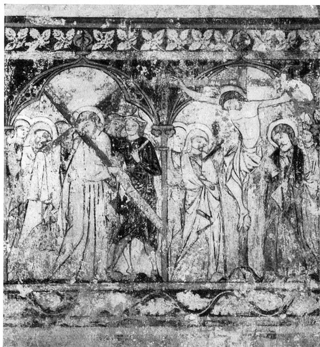
Hochgotische Wandmalereien Begegnung Christi mit seiner Mutter und Christus am Kreuz