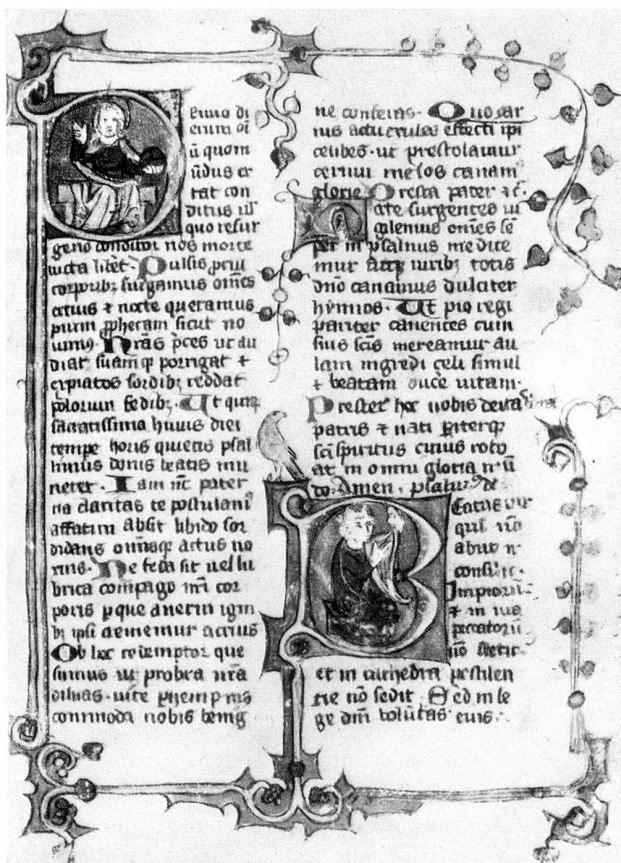
Abb. 1. Beginn des Psalteriums; Seite 17 des Breviers, im Original 11 auf 17 cm

6. Das Commune Sanctorum. Weil die Zahl der Heiligen, auch wenn man von den hervorragendsten, die im Proprium de Sanctis genannt werden, absieht, fast Legion ist und das Officium nicht allen Heiligen gesonderte Gebete widmen kann, so bietet es einen Gebetsdienst, der sich an alle gemeinsam wendet.