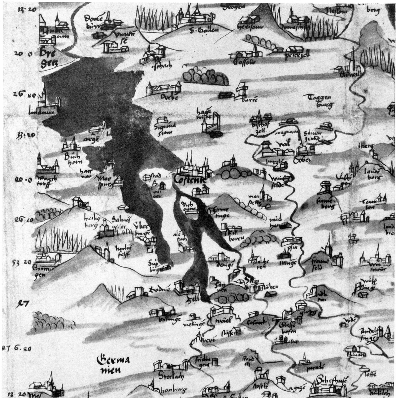
Konrad Türst; Ausschnitt der Schweizerkarte 1496/99 (in Originalgröße)

im Grundriß sozusagen mit dem Seitenriß liebäugelt, so bekennt sich die Darstellung wichtiger Städte, Burgen, Stifte, Klöster und Dörfer ganz eindeutig zur Seitenansicht, ebenso die der spitzzackigen Berge und der unterschiedenen Laub- und Tannenwälder. Türst fügte Einzelbilder, skizzierte Tagebuchblätter eines Reisenden zu einem Mosaik schweizerischer Landschaft, wobei es vor allem noch nicht gelingen wollte, die einzelnen Bergformen zu Ketten zu schweißen und dadurch die Talschaften sauber zu scheiden. Großzügig und elegant zog Türst die braunen Tintenlinien der Zeichnung; das Gelände tönnte er zur Hauptsache grün, beschattete die Berge