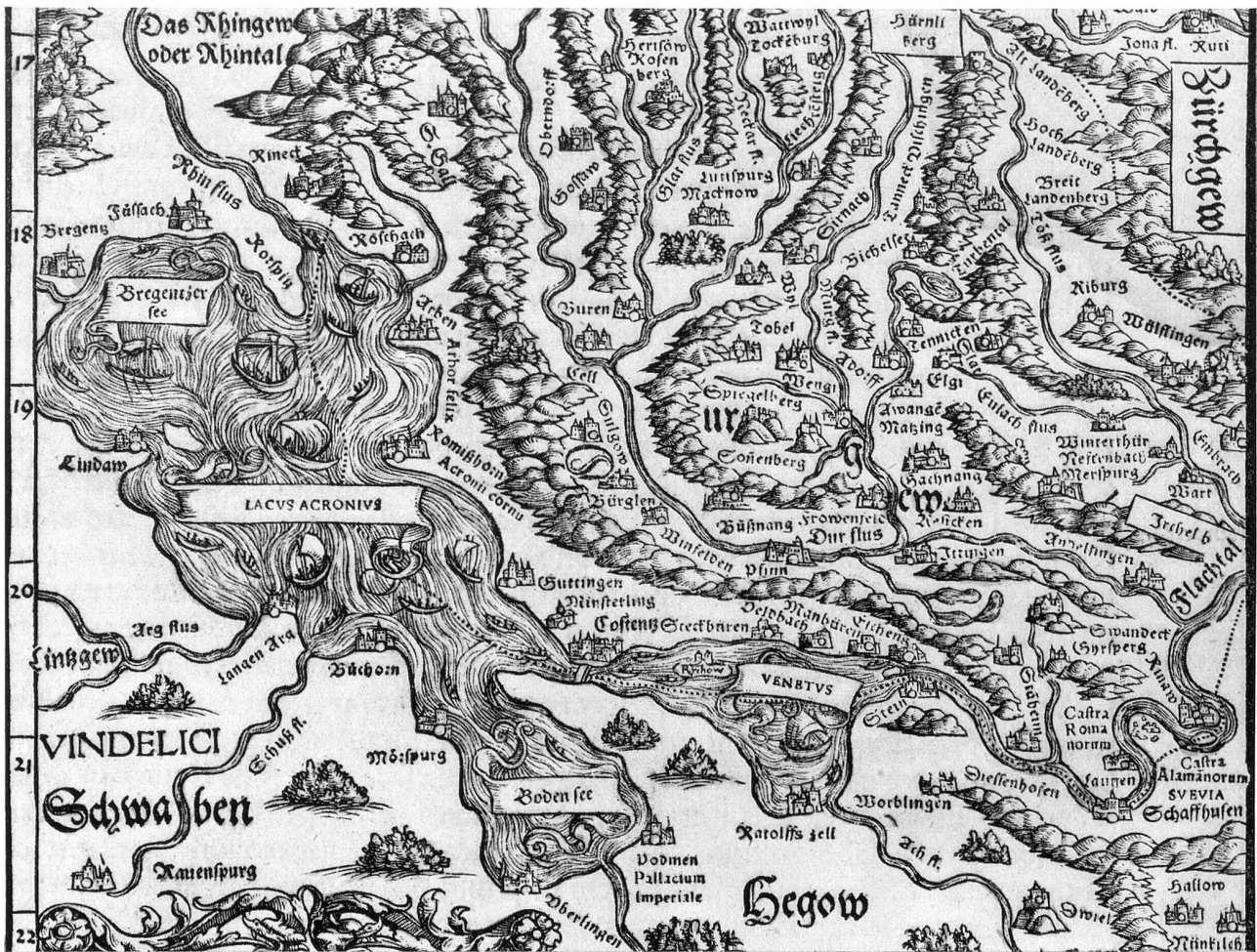
Thurgauische Landtafel des Joh. Stumpf (1547) (Ausschnitt in Originalgröße)

tor in erster Linie und nicht seiner Vorlage zuschreiben möchten.