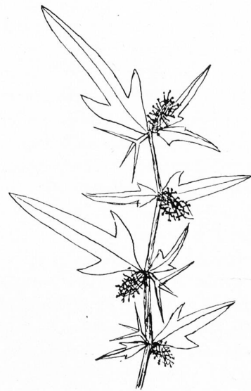
Xanthium spinosum L. / Dornige Wollkette Verbreitung: Kosmopolit der gemäßigten und warmen Zonen der ganzen Erde Typisches Wolladventiv, das mit Wolle aus Australien, Südafrika und Südamerika, sowie aus dem unterem Donauraum und Südrußland eingeschleppt wird Im Thurgau bisher gefunden bei Bürglen, Kreuzlingen-Emmishofen und Romanshorn