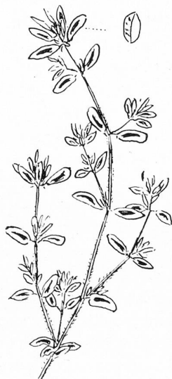
Euphorbia maculata L. | Gefleckte Wolfsmilch Verbreitung: Nordamerika von Kanada bis Texas und Florida Im Thurgau bei Arbon und Romanshorn gefunden

Es ist leicht verständlich, daß gerade Bahnhöfe, insbesondere solche mit großem Umschlag, Verbreitungszentren von Gewächsen fremder Herkunft werden und sein können. Die großen Geleiseanlagen in Romanshorn haben mir bisher alljährlich irgendwelche floristische Novitäten geliefert. Waren es 1949 die mediterrane Lippenblütlerart Sideritis montana L. und der aus Ostasien oder Nordamerika eingeschleppte zweijährige Beifuß ( Artemisia biennis L.); war es 1950 die erstmalig in der Schweiz gefundene Euphorbia acuminata Lam. aus Niederösterreich und der nordamerikanische Korbblütler Ambrosia trifida L. mit hochinteressanten Blühe- und Befruchtungsverhältnissen; war es 1951