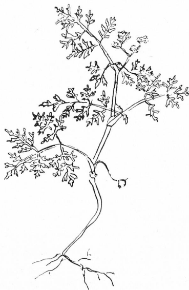
Caucalis Lappula (Weber) Grande, dies ist der jetzt gültige Name (Früher Caucalis daucoides ) / Möhrenartige Haftdolde Verbreitung: Mittelmeergebiet bis Persien, West- und Mitteleuropa Im Thurgau bisher gefunden bei Dießenhofen, Frauenfeld, Müllheim-Wigoltingen und Romanshorn

ranen dreihörnigen Labkrautes ( Galium tricornis Stokes) fand sich auch das ebenfalls mediterrane Kuhkraut ( Vaccaria pyramidata Medikus), das gesamt europäische, aber recht seltene Ackernüßchen ( Vogelia paniculata Hornem). Da ragten ferner die undurchblätterten Blüten-