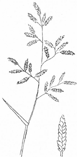
Eragrostis minor Host | Kleines Liebesgras

Dieser Vorgang ist bereits von einer Reihe eingewanderter bzw. eingeschleppter Pflanzen bekannt geworden. Ein Beispiel dafür ist das kleine Liebesgras ( Eragrostis minor Host), das wir in den Sommermonaten sicher auf jedem Bahnhof des Kantons, aber auch auf Sportplätzen und gelegentlich auch auf Ödland antreffen. Das schöne, zierliche, mit schieferblauen Ähr-