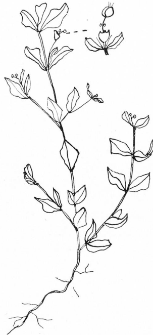
Euphorbia nutans Lagasca | Nickende Wolfsmilch

chen geschmückte Gras ist ein zugewandertes Element der Mittelmeer- und der pannonischen, das heißt aus den östlichen Donauländern stammenden Pflanzenwelt.