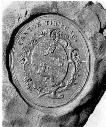
Das erste Siegel des Kantons Thurgau 1803

in Gang. Von Anfang an stand fest, daß man sich nicht mit einem zentralen Fest in der wenig zentral gelegenen Kantonshauptstadt begnügen wolle, das Jubiläum sollte alle Landesteile erfassen. So gab man den größeren Gemeinden die Empfehlung, selbständig ein volkstümliches Fest aufzuziehen, und zwar am Samstag, dem 27. Juni, während man in der Hauptstadt für den fol-