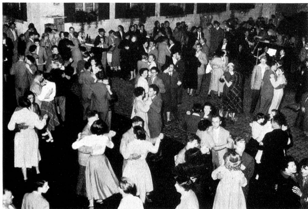
Froher Tanz in Steckborn