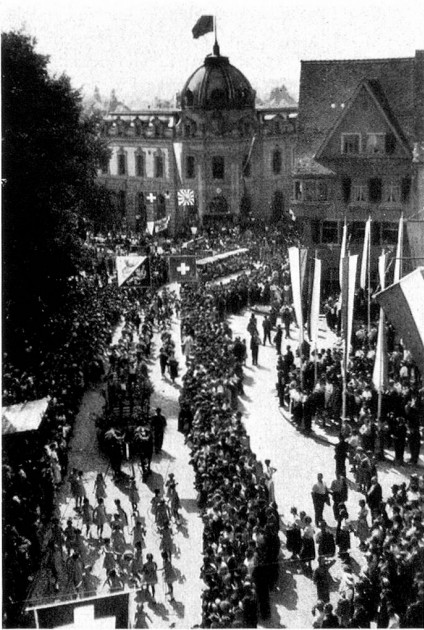
Der Umzug vor dem Rathaus