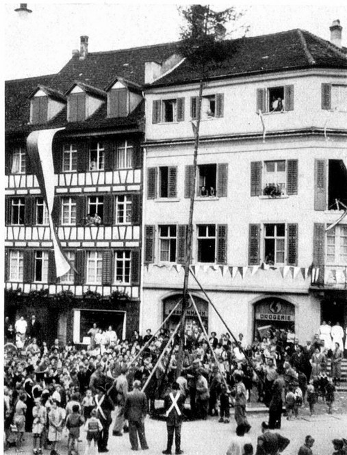
Die Bischofszeller errichten einen Freiheitsbaum