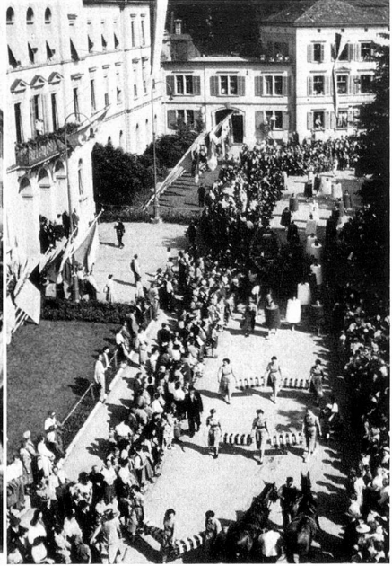
Die Steckborner vor dem Regierungsgebäude