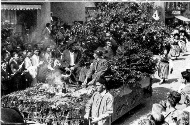
Von oben nach unten: Die Gäste an der Spitze, der erste «Saurer», die Kinder von Frauenfeld, die Jäger aus dem Tannzapfenland