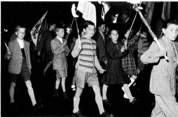
Die Romanshorner Jugend mit Fackeln und Fahnen