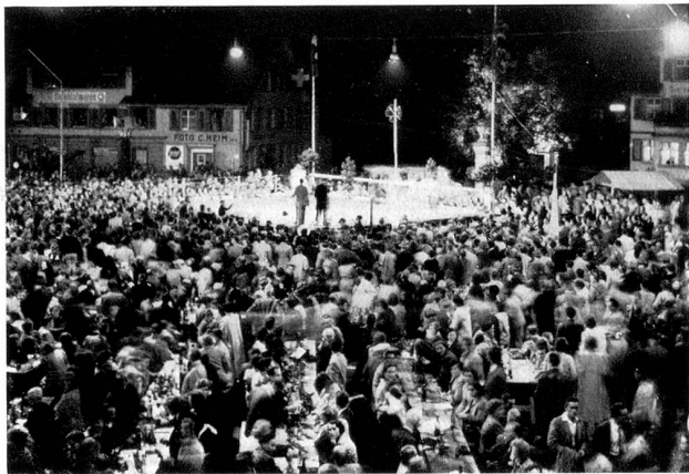
Volksfest in Amriswil

Der Junihimmel war leider sehr regendurchlässig. Man brachte die Fahnenstangen ohne große Mühe in den weichen Boden, und es war sehr zu befürchten, daß das unbeständige Wetter auch den Festen im Freien übel mitspielen werde. Thur und Murg schwollen vor Hochwassern, als der Festsamstag da war, und noch