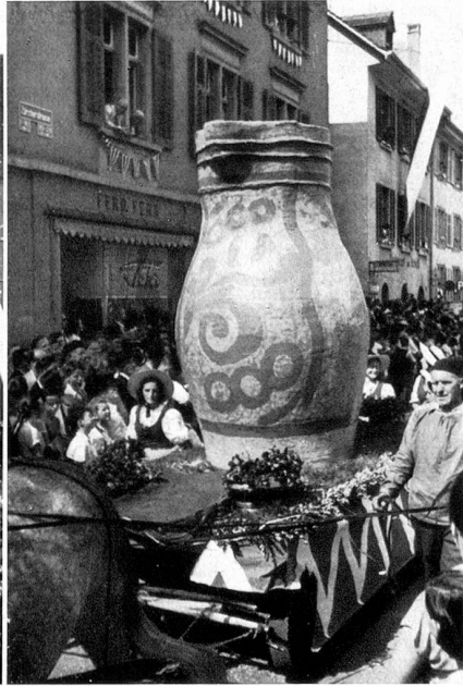
Der Mostkrug aus Bischofszell