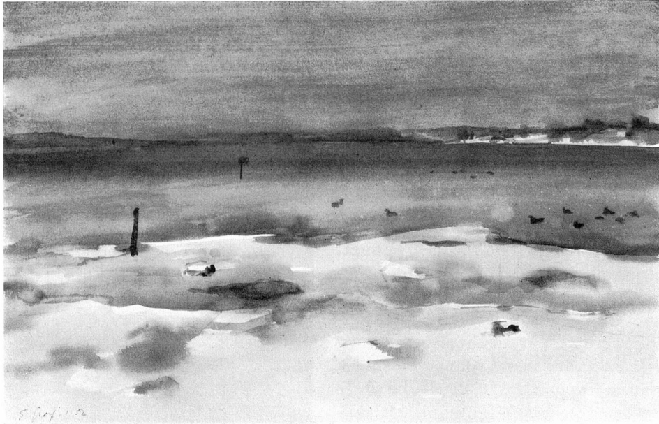
Winter am Untersee Aquarell 1952

Suchender: Ich glaube zu erkennen, aber sage, gehörst du auch zu denen, die in der heutigen Zeit nur gestaltete Düsterteit als einzig wahres Lebensbild gelten lassen und deshalb die Kunst, die aus der Lebensfreude sprießt, als ein klein wenig zweitrangig, ein wenig dem Publikumsgeschmack huldigend, abwerten.