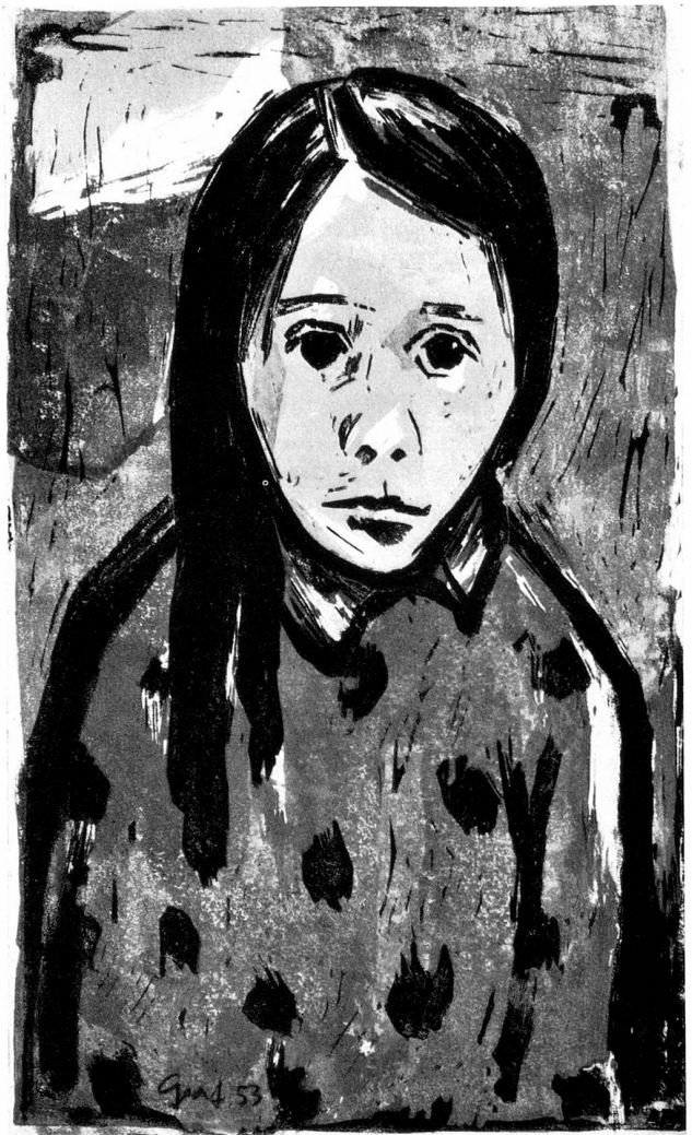
Mädchen aus Wien Linolschnitt, vierfarbig 1953

Freund: Nein, er lehnt sich nicht an, er ist ihnen gesinnungsnah. Er schaut in dieselben menschlichen Tiefen, aus denen auch er den Ruf zum Gestalten hört. Finden sich in seinem künstlerischen Ausdruck verwandtschaftliche Züge, so liegt dies fast folgerichtig im gleichgearteten menschlichen Erleben und demnach in der wesensnahen, künstlerischen Aussage: Das