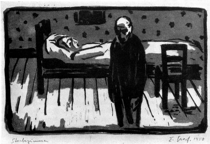
Sterbezimmer Linolschnitt, zweifarbig 1950

Einzelnschicksal trägt das Antlitz Tausender, ist Zeichen eines Zustandes auf Erden; die erregte Seele äußert sich heftig und der geformte, gültige Ruf kennt nur die äußerste Beschränkung auf das Wesentliche. Bringst du nun Grafs Werke in Beziehung zu denen der genannten Künstler, wirst du sehen, daß sie ihnen nicht als Epigonenkunst verhaftet, sondern eine Bereicherung derselben im Sinne eines neuen Beitrages sind. Jedes Blatt lebt, künstlerisch gesehen, ganz aus dem Formwillen, der geistigen Klärung, der Handschrift und Atmosphäre des Künstlers. Schau, wie in jedem Blatt das Inhaltliche die ihm gemäße und daher so überzeugende Gestalt erreicht hat. Die seelischen