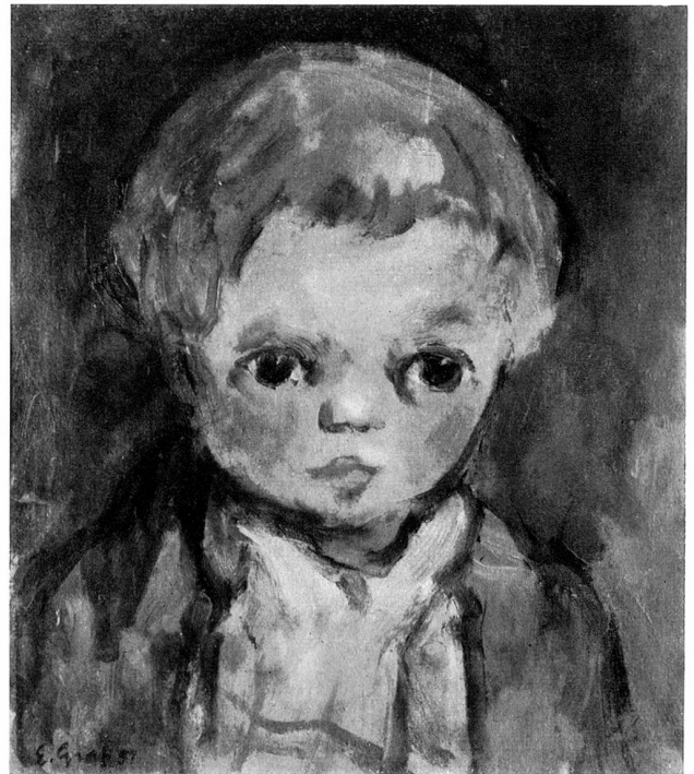
Hansli Öl 1951

Freund : Es ist jeweils ein langer, zehrender und scharfer Selbstkritik ausgesetzter Weg von der ersten Skizze bis zur gültigen Fassung. Zeichnung um Zeichnung entsteht, weglassend, klärend und mit den graphisch-technischen Möglichkeiten sich auseinandersetzend. Wo immer auch Grafs Werke in Ausstellungen des In- und Auslandes zu treffen sind, werden sie denn