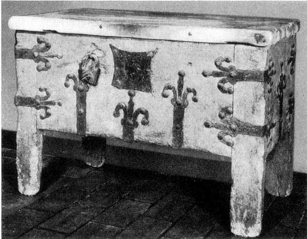
Gotische Truhe Kloster Münsterlingen

Ein bekannter, nun verstorbener Historiker der Innerschweiz hat einmal gesagt: Es ist schade um euch Thurgauer! Ihr seid ein wackeres, gescheites Volk, aber – ihr habt so gar keine Tradition!