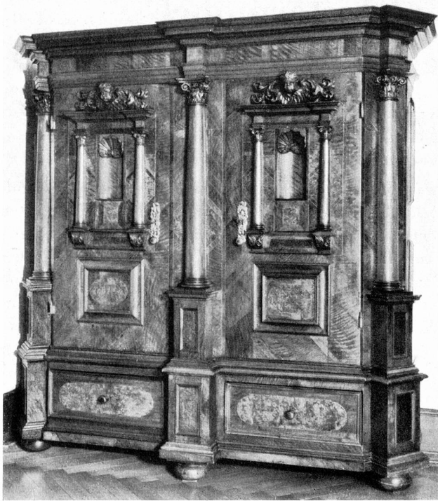
Thurgauer Barockschrank. 17. Jahrhundert Kloster Münsterlingen