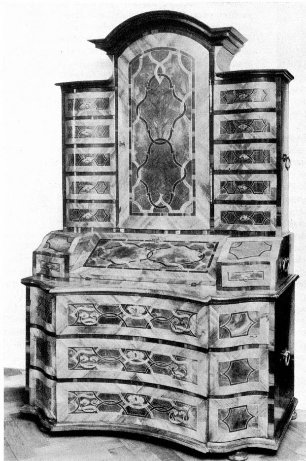
Barock-Stiftsmöbel um 1742 Kloster Fischingen

Haben wir nicht nach Zeugen gesucht? Hier stehen sie. Sie waren nur lange unter Staub und Trauer vergraben. So wie wir sie aber heute besitzen, spiegeln sie das Bild einer großen, ruhigen, in sich gesammelten Zeit. Sie sind ein Bestandteil des Begriffes Heimat, denn einmal wuchsen sie aus unsern Gärten und Wäldern auf und es ist gut, zu wissen, daß sie nun wieder uns gehören.