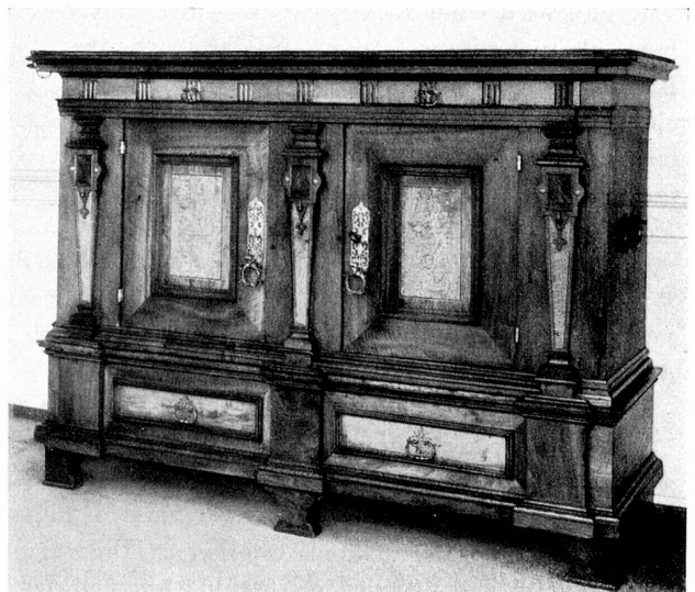
Renaissance-Schranktruhe, 16. Jahrhundert Kreuzlingen

Solche Gedanken kommen einen an, wenn man in der «Römerburg» in Kreuzlingen ist. Dort ist seit einigen Jahren eine wahre Heimstatt für lang Verlorenes und Verschollenes gewachsen. Der sie schuf, ist kein Künstler, kein Sammler im landläufigen Begriff – aber ein Mensch mit dem klaren, unverfälschten Sinn für das Echte, Wahre, Bodenständige. Er hat schon als Kind die Vergangenheit gesucht und wurde allmählich besessen vom Wunsche, seiner Ahnen alten Besitz wie-