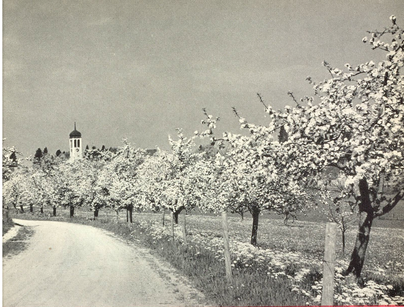
Blihet in Neukirch i. Egnach Foto G. Schmid Praktische Baumschnittübungen an der Landwirtschaftlichen Schule Arenenberg Foto G. Schmid