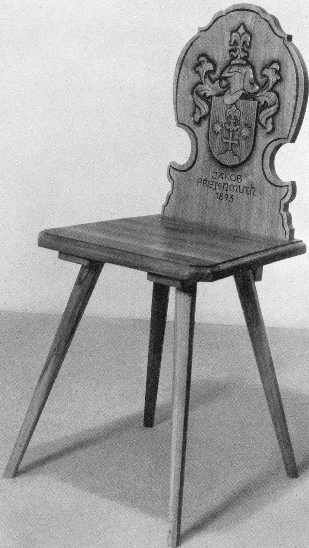
Eine Arbeit aus der Werkstätte für Möbel und Innenausbau Jak. Freyenmuth, Frauenfeld