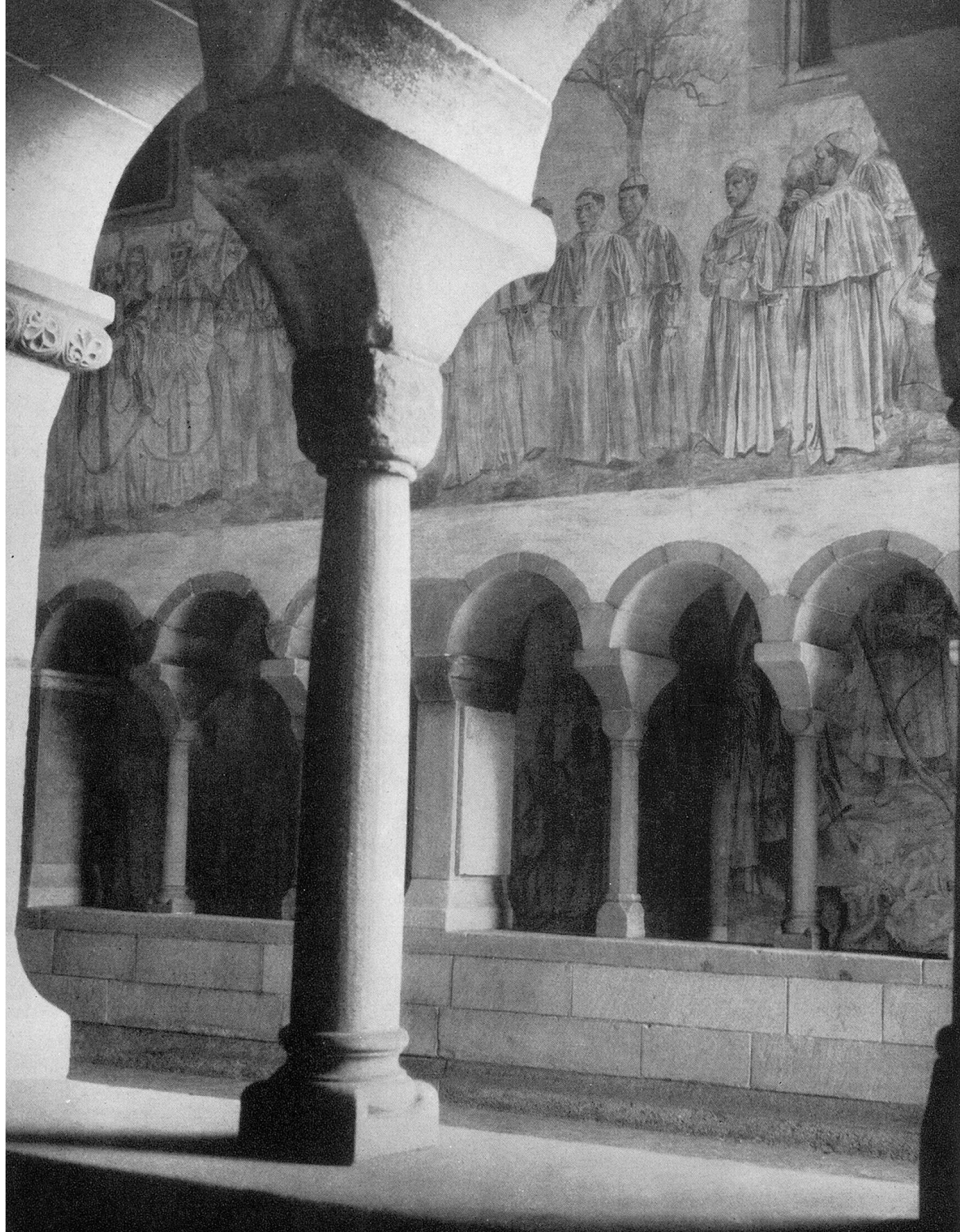
Paul Bodmer: Fresken in Kreuzgang des Fraumünsters