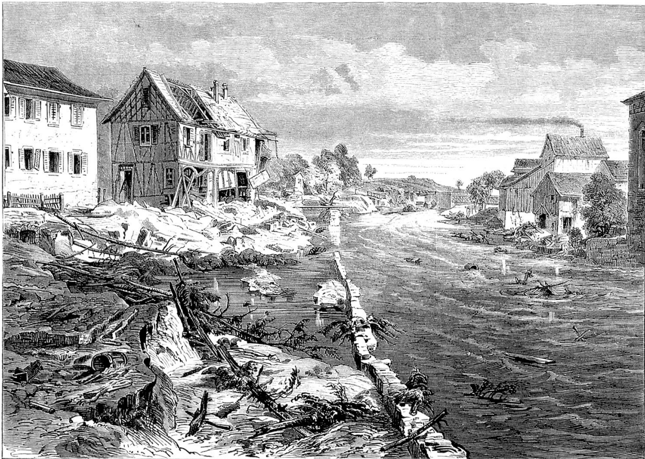
Die Ueberschwemmung in der Ostschweiz: Frauenfeld an der Murg nach der Ueberschwemmung. Nach einer Zeichnung von Joh. Weber.