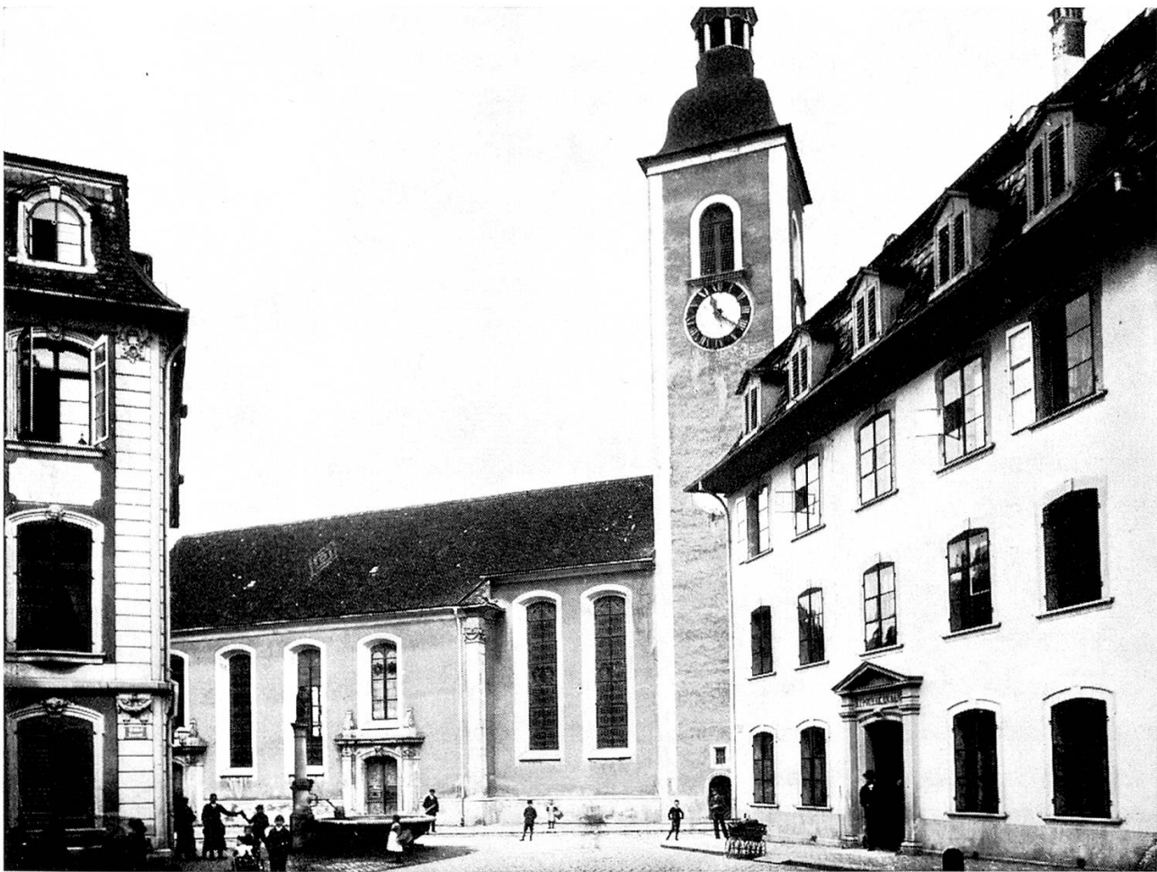
Die alte katholische Kirche in Frauenfeld.

mit ein paar vielsagenden und doch nichts verratenden Worten noch höher zu spannen. Ganz im heimlichen hatte sie am frühen Morgen die ersten Apfelküchlein dieses Sommers gebacken. In der großen braunen Schüssel wohlverwahrt, entstiegen sie noch warm der Tiefe des Korbes. Ja, nun wußten wir, warum sie in den letzten Tagen immer bemüht gewesen war, von den gefallen Kornäpfeln die schönsten vor unsern Freßmäulern in Sicherheit zu bringen.