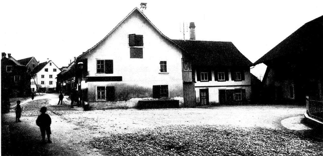
Die alte «Traube» im Langdorf bei Frauenfeld.