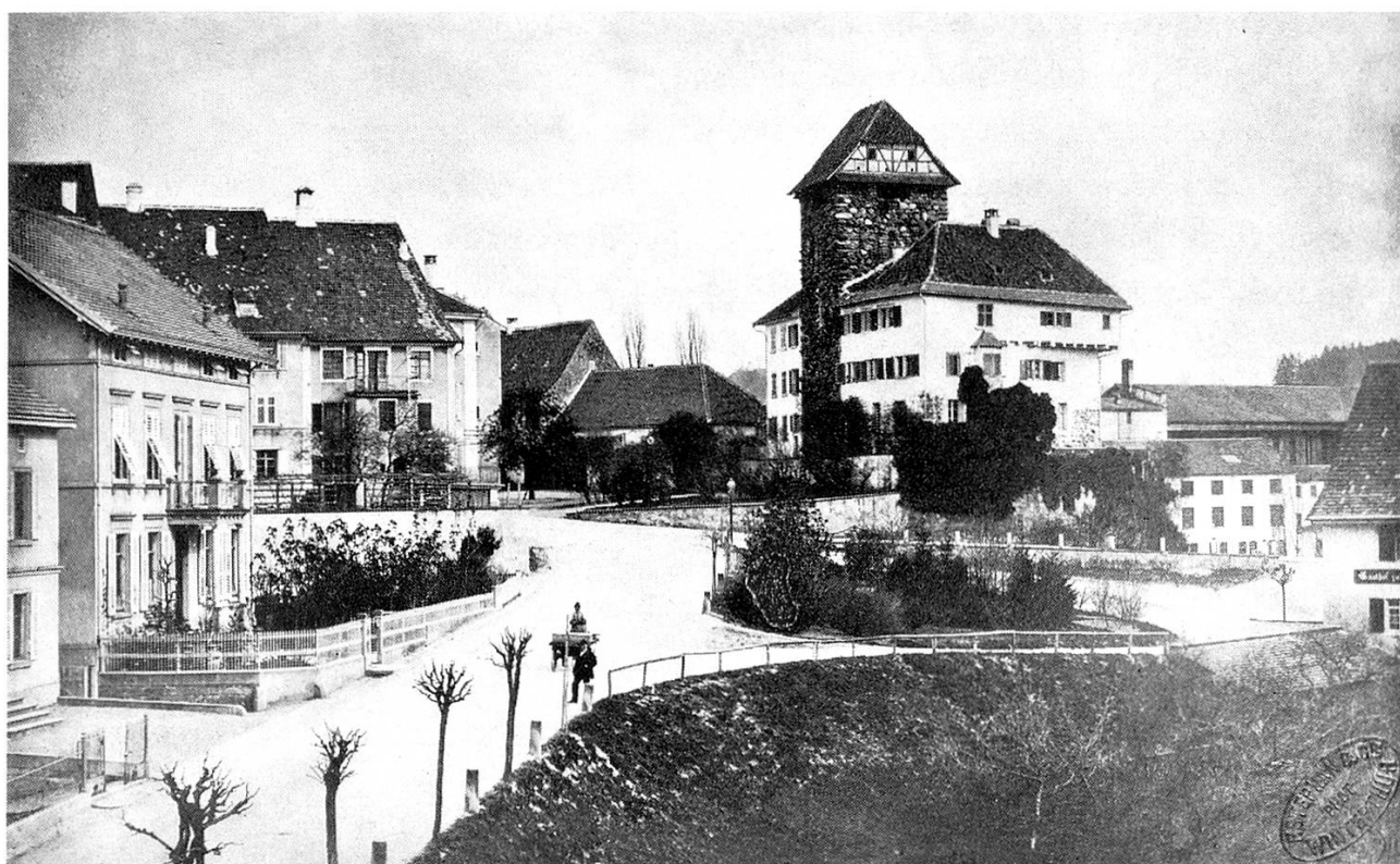
Die Rheinstraße in Frauenfeld vor der Erstellung des Postgebäudes.

gleichem Maße schien auch die Arbeit ihren Reiz für unsern Helfer eingebüßt zu haben. Die Ruhepausen wurden immer häufiger; er rankte und reckte sich wiederholt unter schwerem Ächzen. Und auf einmal warf er seine Sichel in weitem Bogen auf die Güterstraße hinüber. «Soll mich der Gugger holen, wenn ich so ein Instrument noch ein einziges Mal in die Hand nehme!» schwor er sich grimmig. «Lieber wollte ich ohne Fleppen 1 und Tritte 2 nach Sibirien tippeln, als daß ich mich noch zwei Minuten lang bei gesunder Vernunft mit dieser blödsinnigen Bütz abgeben würde.»