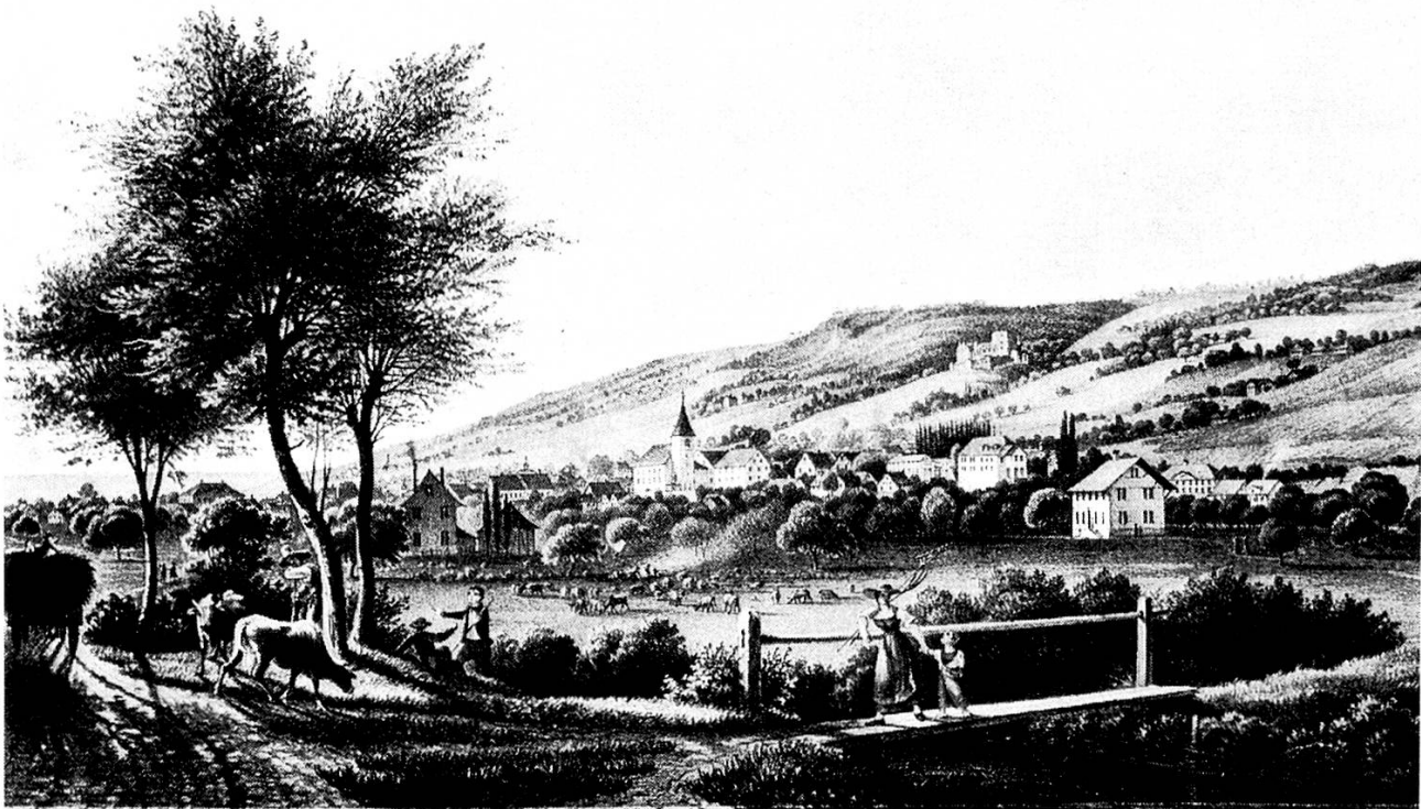
Weinfeldern. Lithographie von Emanuel Labhart.

auch jedem Tagwerk eine helle Seite abzugewinnen. Mit ihrem Schatz von gereimten und ungereimten Lebensweisheiten, Wetterregeln und alten Merkwörtern geizte sie nicht; sie wußte, daß ein Quintchen Freude und ein Bröcklein Kurzweil das Bittere erträglich und das Erträgliche süß machen können.