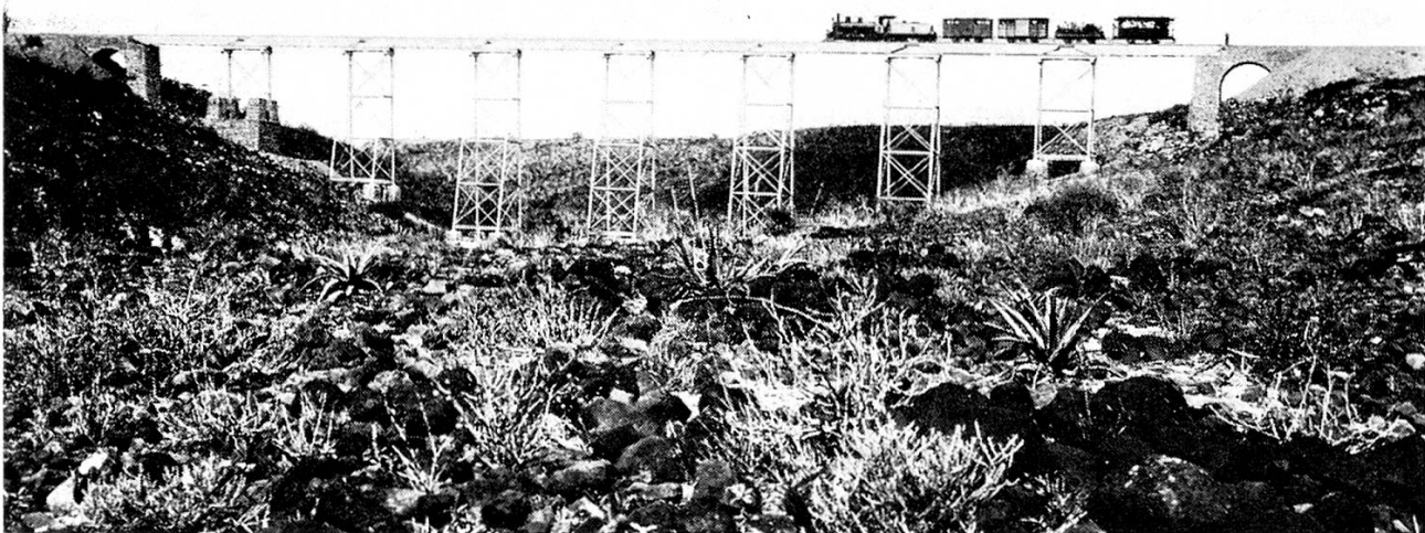
Der Holl-Holl-Viadukt (in der Nähe von Djibouti).

Negesti. Menilek II. war nach Ilgs Zeugnis eine außerordentliche Persönlichkeit, die durch kluge Neugier, ungemeine Energie und hintergründige Schlaueit bestach. Die Auseinandersetzungen mit Italien, die den Verlauf der Jahre 1890 bis 1896 bestimmten, zeigen Menilek und Ilg in enger Zusammenarbeit bei der Aufrüstung des Heeres und bei diplomatischen Initiativen zur Sicherung der von Italien angefochtenen äthiopischen Unabhängigkeit. Kein anderer Ausländer konnte so wie Ilg als Advokat äthiopischer Souveränität auftreten, aber diese Rolle brachte auch viele böswillige Verleumdungen und Unterstellungen ein. Ilg verspürte zum erstenmal, was es hieß, sich für eine «exotische» Sache zu exponieren, wie schwierig es überdies war, Geldgeber für Entwicklungsprojekte zu gewinnen. Gewiß, der äthiopische Sieg über