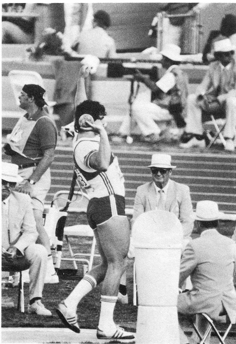
Olympiade Los Angeles 1984

zielen. Warten wir die EM 1986 ab, dann wissen wir mehr. Man muß auch berücksichtigen, daß im Kugelstoßen momentan die Europäer vorne liegen, mit Ausnahme einiger weniger Amerikaner.» Die Sache ist auf einen einfachen Nenner zu bringen: Werner Günthör zählt zu den Top-Ten auf der Welt.