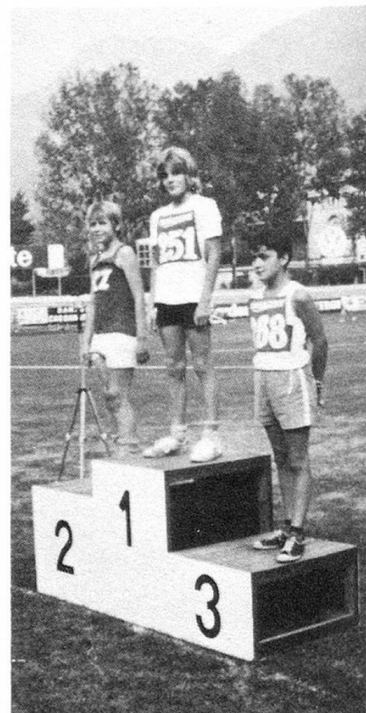
1972 Schweizer Meisterschaft in Lugano