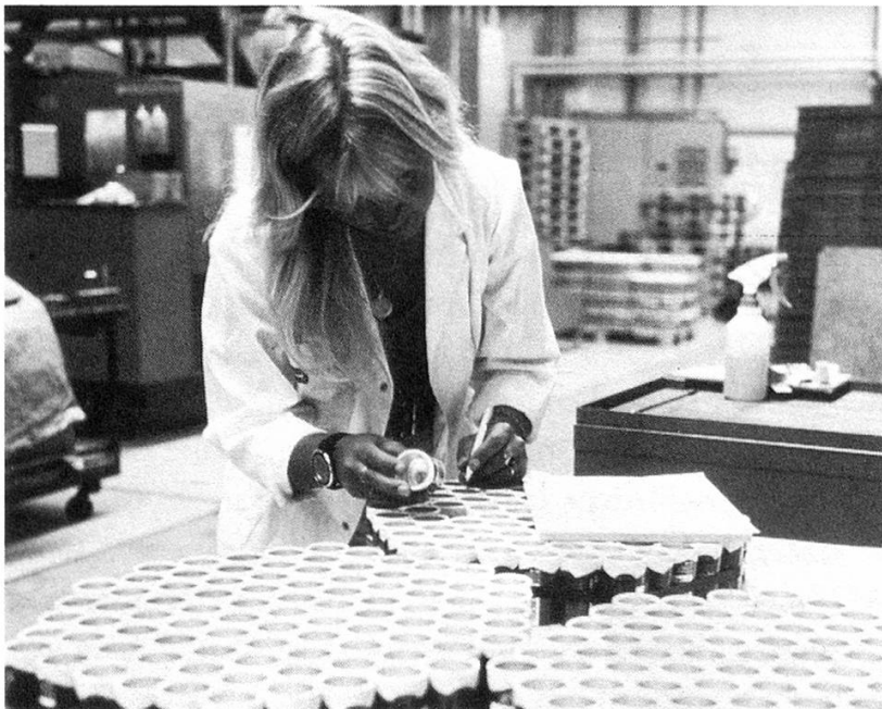
Blick in die Produktion: Eine Milliarde Dosen im Laufe von 30 Jahren wurden in Matzingen hergestellt.