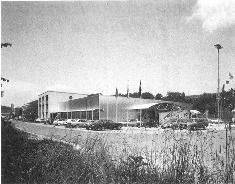
Das Nussbaum & Guhl-Stammhaus: Der Bau, der 1988 bezogen werden konnte, ermöglicht effiziente Betriebsabläufe.

So wurde im Osten Deutschlands, genauer in Chemnitz/Oberlichtenau, das Dosenwerk des VEB Aerosolautomat übernommen. Man setzte damit nicht nur einen Fuß in den EG-Raum, sondern nahm auch die Ostmärkte ins Visier. Was 1990 mit einer gewissen Abenteuerlust begann, hat sich in der Zwischenzeit zu einem modernen Produktionswerk mit drei Produktionslinien entwickelt. Es waren erhebliche Investitionen nötig, um die Voraussetzungen für eine optimale Produktion zu schaffen. Das Werk hat sich auf die Herstellung von Aerosol-Druckbehältern und Gewürz-Streudosen spezialisiert. Dank des Know-hows des Mutterhauses und qualifizierter Mitarbeiterinnen und Mitarbeiter entwickelt sich der neue Standort positiv. Kurz zuvor hatte man in Matzingen kräftig modernisiert und ausgebaut: Im Jahre 1988 war der neue Fabrikationsbetrieb mit sechs Produktionslinien feierlich eingeweiht worden.