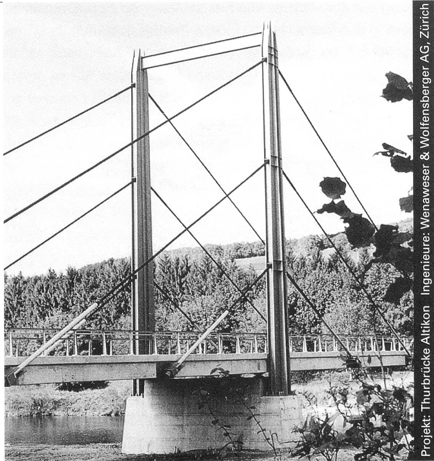
Projekt: Thurbrücke Altikon Ingenieure: Wenaweser & Wolfensberger AG, Zürich

Nur mit diesem Baustoff sind die grössten Spannweiten und Höhen möglich, dies mit Berücksichtigung der Wirtschaftlichkeit und des vorteilhaften Leistungsgewichtes. Stahl bietet eine nahezu unerschöpfliche Fülle von Möglichkeiten, Ihre Ideen zu verwirklichen.