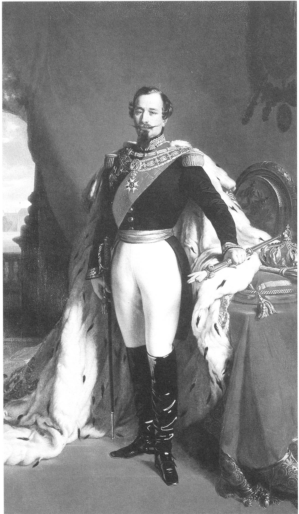
Franz Xaver Winterhalter: Napoleon III. im Krönungs- ornat. Napoleonmuseum Schloss Arenenberg