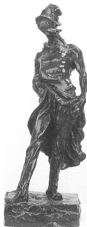
Honoré Daumier, Ratapoil – Karikatur auf Louis Napoléon als Prinzpräsi- denten, Napoleonmuseum Thurgau Schloss und Park Arenenberg

Diese Lücke schliesst die Ausstellung nun und nimmt sich besonders dieser Zeit an. Kostbare Möbel aus dem Kinderzimmer des Prinzen zeigen, wie früh seine Mutter ihn auf Napoleon I. als Vorbild polte. Erste Porträts vermitteln eher das Bild eines – fast möchte man sagen «mädchenhaften» – schüchternen Knaben, der sich seiner Rolle noch überhaupt nicht bewusst scheint. Später entdeckt der Besucher einen zu allen Streichen aufgelegten Lausbuben, voller künstlerischer Bega-