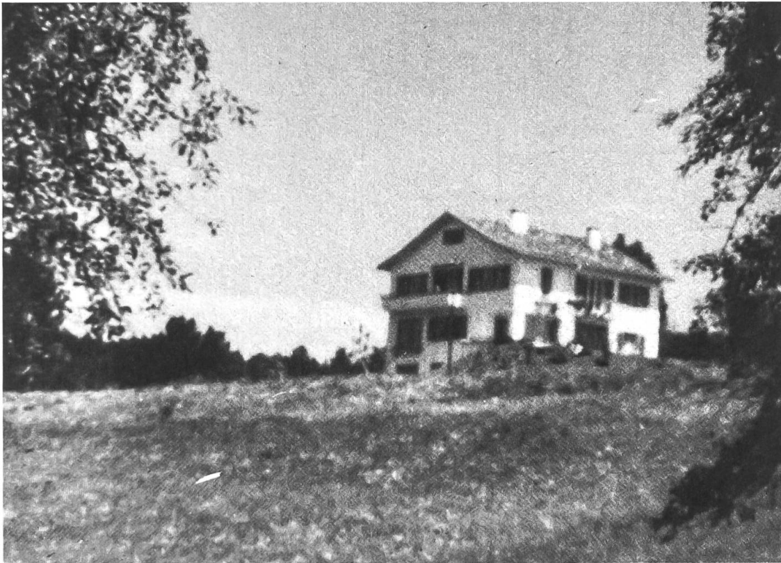
Abb. 20: Thomas Manns Haus an der Glärnischstrasse 12 in Erlenbach. 129