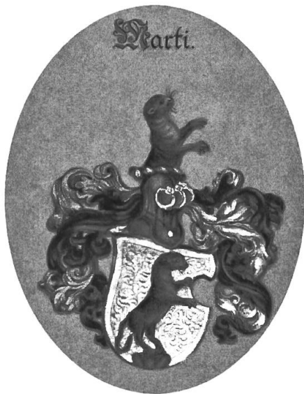
Abb. 10: Das Wappen der Marti von Glarus. Es zeigt einen «in Gold auf grünem Dreieck, schwarzen, steigenden Marder». 42