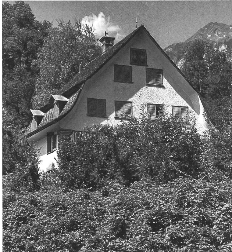
Abb. 3: Das Haus in der Wiese in Glarus. 8

Entsprechend findet es sich, wenn schon nicht in seinen Romanen, so doch zumindest in seinen Tagebüchern erwähnt. In seinem Eintrag vom 5. Februar 1934 schreibt Thomas Mann: