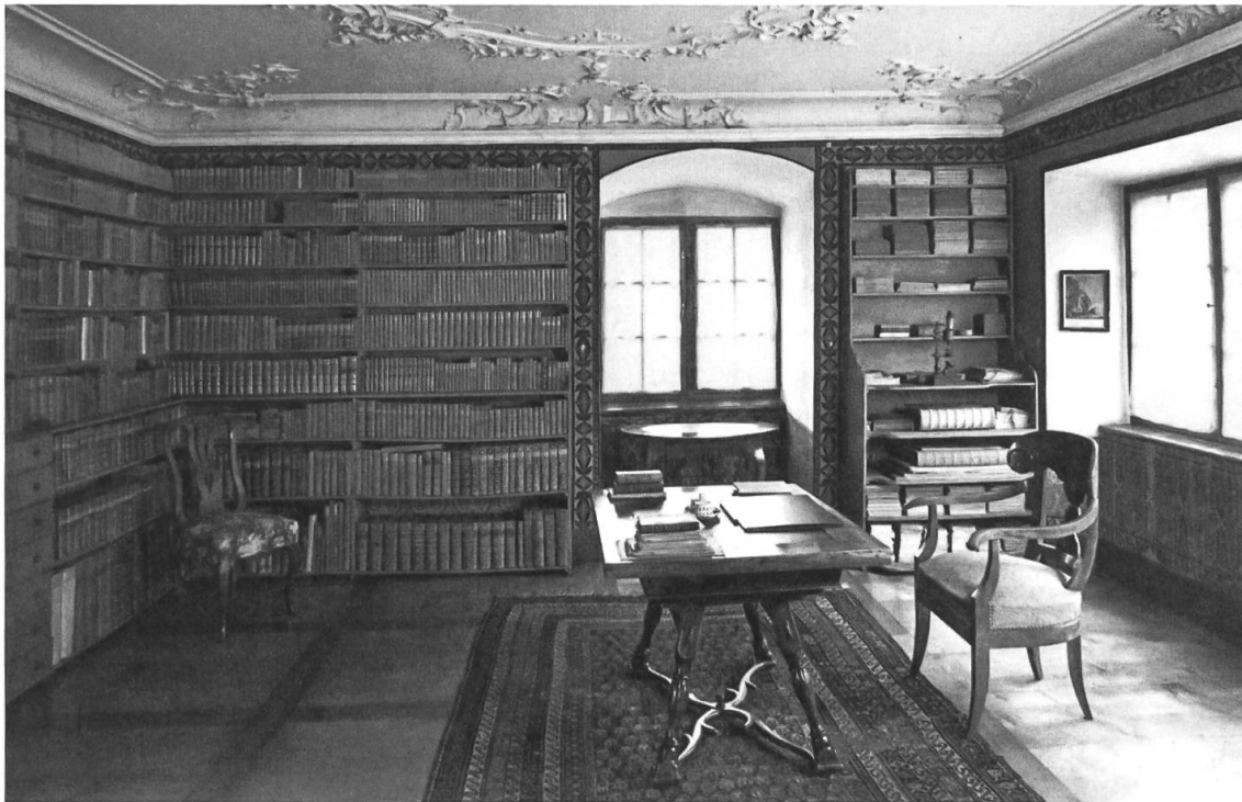
Abb. 6: « [...] den Katalog der Hausbibliothek aus dem 18. Jahrhundert studiert» Salon des Hauses in der Wiese mit Blick auf die berühmte Bibliothek. 24

Gestalter einen freundlichen Empfang. Thomas Mann erfreut sich im Glarnerland der in so hohem Masse verdienten Würdigung.» 20 So mag es wohl auch von Thomas Mann empfunden worden sein. Er scheint, trotz stadtglarnerischer Schattenkälte, vergnügt gewesen zu sein. Sein Tagbucheintrag des 6. Februar 1934 hält fest: