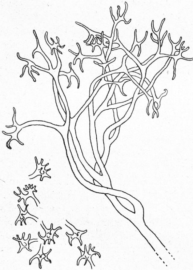
Fig. 3. Konidienträger von Bremia Lactucae Regel auf Lactuca Scariola .

Die Konidienträger, die man im Freien sammelt, variieren in ihrer Größe zwischen 200 bis 500 \mu ; werden sie aber unter einer feuchten Glasglocke gebildet, so sind Bäumchen