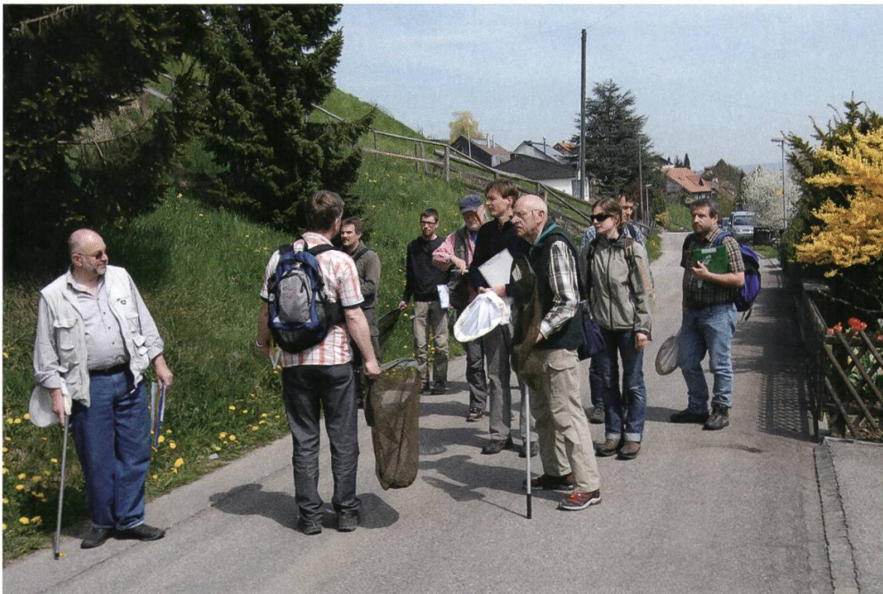
Abbildung 1: Instruktionsanlass der Tagfalterspezialistinnen und -spezialisten im Jahr 2009.

«Der Einbezug von Amateuren – ich bezeichne sie bewusst nicht als Laien – ist sehr positiv zu werten. Bei der Ausübung ihres Hobbys erheben sie wertvolle Daten für die Wissenschaft und für den Naturschutz. Ohne die Amateure wären viele Monitoringprojekte gar nicht durchführbar, da sie unbezahlbar wären.» Mathis Müller, Tagfalterspezialist