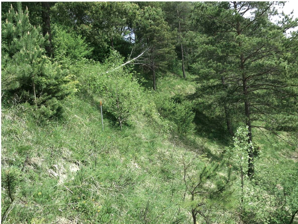
Abbildung 1: Einer der 15 kartierten Tagfalterstandorte, der Funkeplatz bei Berlingen, ist eine Trockenwiese von nationaler Bedeutung. Der etwas verbrachende Halbtrockenrasen bietet zwei im Thurgau seltenen Blutströpfchen-Arten Lebensraum, dem Beilfleck-Widderchen ( Zygaena loti ) und dem Kleinen Fünffleck-Widderchen ( Zygaena viciae ).