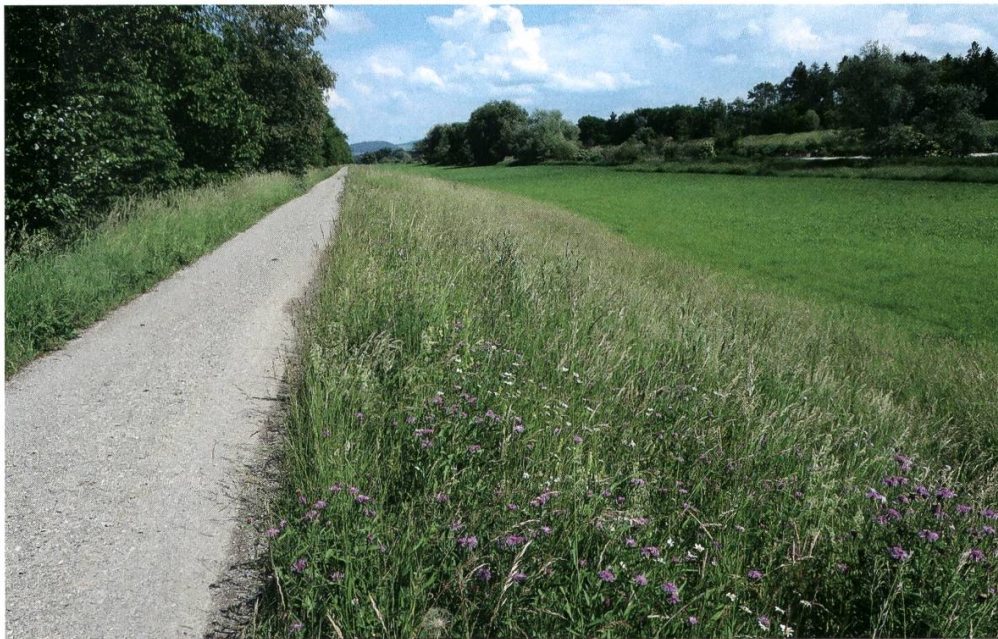
Abbildung 5: Auf den Dämmen der Thur bei Uesslingen gab es in den letzten Jahren Funde von eingewanderten Tagfalterarten.

Kantons Thurgau, wieder nachgewiesen werden. Der Wachtelweizenscheckenfalter kommt dort zwar noch verbreitet, jedoch nur in geringer Dichte vor und wurde auch entlang des nahegelegenen Transekts des BDM TG beobachtet. Der Rundaugenmohrenfalter konnte nur mit zwei umherstreifenden Individuen nachgewiesen werden. Auf den sehr extensiv bewirtschafteten Wiesen und Weiden im und um das TWW-Objekt Meiersbode ( Abbildung 4 ) sowie an sonnigen Stellen im angrenzenden Wald könnte die Art aber längerfristig wieder vorkommen. Das Hörnlibergland und insbesondere das Steinenbachtal bieten auch Potenzial für weitere verschwundene Arten wie den Gelbringfalter ( Lopinga achine ), den Frühlingsscheckenfalter ( Hamearis lucina ), das Grosse Fünffleck-Widderchen ( Zygaena lonicerae ) oder das Thymian-Widderchen ( Zygaena purpuralis ), welche alle noch im Gebiet des oberen Tösstals auf Zürcher Boden vorkommen. Mit gezielten Aufwertungsmassnahmen wie dem Schaffen von lichten Waldflächen, gestuften Waldrändern mit breitem Saum oder sehr extensiven Wiesen und Weiden könnten möglicherweise wieder Bestände dieser Arten im Thurgau etabliert werden.