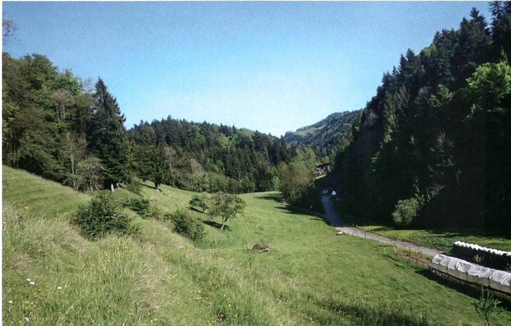
Abbildung 4: Das TWW-Objekt Meiersbode im Steinenbachtal bietet mit seinen sehr extensiv bewirtschafteten Wiesen Lebensraum für seltene Tagfalterarten.

In den Jahren 2013 bis 2015 sowie 2017 konnten weder der Falter noch die Eier an den im Hagelriet zur Eiablage genutzten Schwalbenwurzenzianen ( Gentiana asclepiadea ) gefunden werden. Damit ist die Art vermutlich aus dem Thurgau verschwunden. Über diesen Verlust hinwegtrösten mag der Umstand, dass im Jahr 2014 zwei andere Arten von Ameisenbläulingen, welche auf der Roten Liste ebenfalls als stark gefährdet eingestuft sind, nach über 50 Jahren wieder im Thurgau entdeckt wurden: Am selben Tag gelang der Nachweis des Hellen Wiesenknopf-Ameisenbläulings ( Maculinea teleius , Abbildung 3) im Seebachtal durch Jonas Frei und Andreas Hafner sowie in der Schaarenwis durch Ulrich Pfändler. In der Schaarenwis fand Ulrich Pfändler zudem wenige Tage später auch noch den Dunklen Wiesenknopf-Ameisenbläuling ( Maculinea nausithous ).