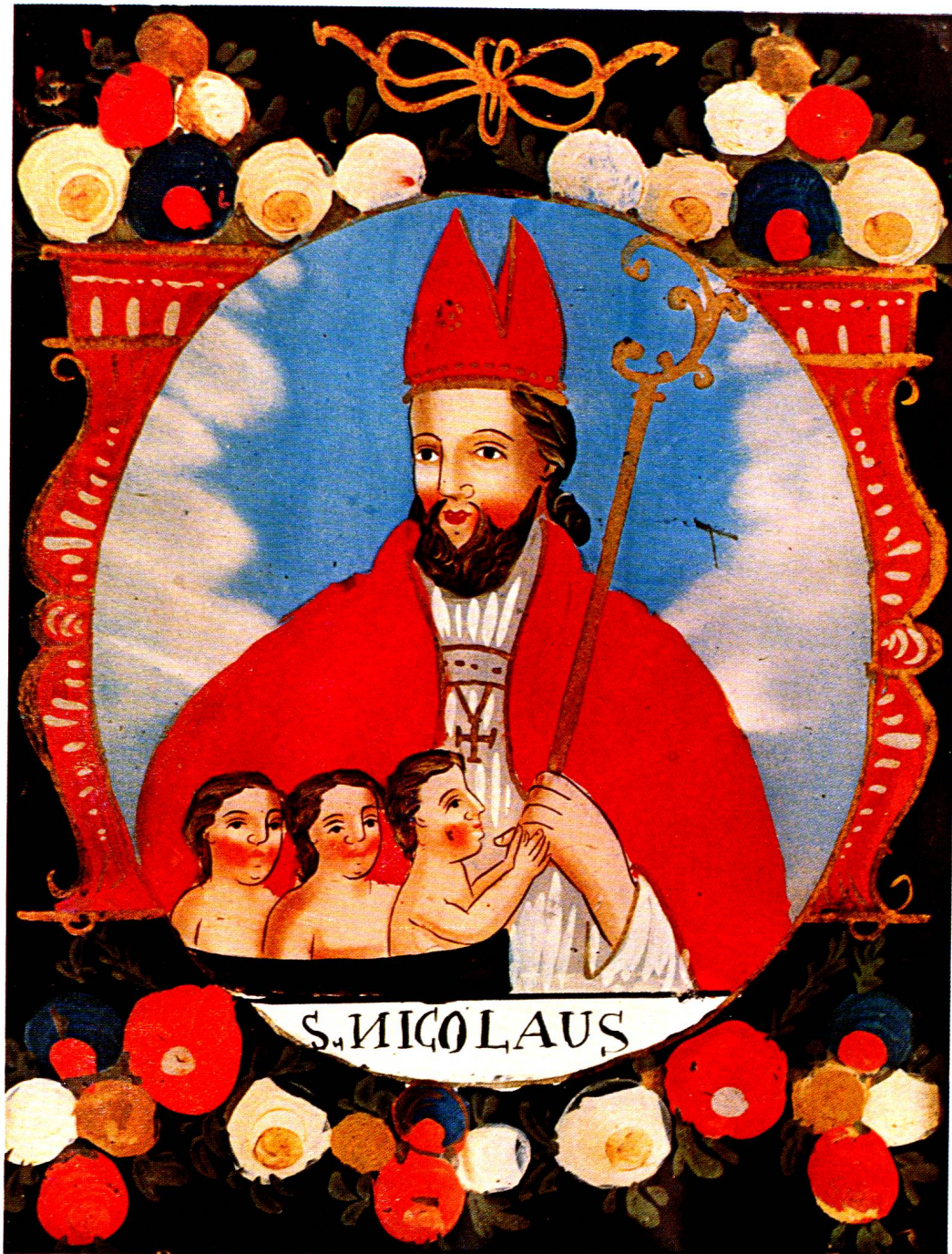
St. Nikolaus mit den drei heiratslustigen Mädchen. Farbenprächtiges Hinterglasbild aus dem Elsass ca. 1820 (Toggenburger Privatbesitz).