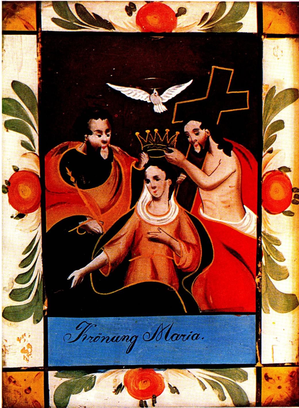
Krönung Mariä mit hl. Dreifaltigkeit, geziert mit einfachem bäurischem Dekor. Schwarzwald 1840 (Toggenburgisches Heimatmuseum Lichtensteig).