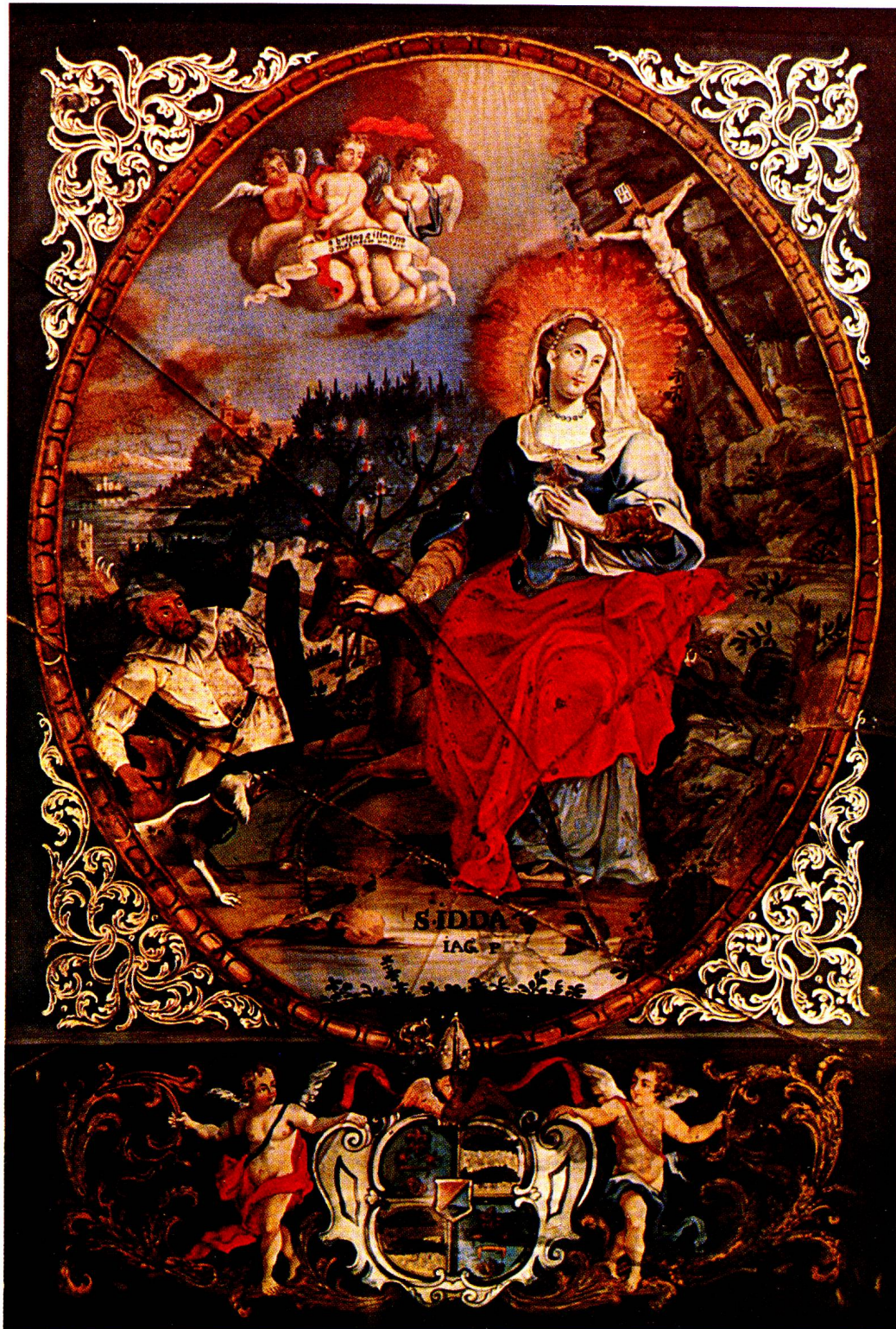
St. Idda v. Toggenburg, wie sie, nach der Legende, von ihrem reuigen Gemahl Heinrich in der Einöde aufgefunden wird. Beliebte Ovalform des Barock und Rokoko mit reichem Dekor. Im Unterteil Abtswappen v. Fischingen. Zweite Hälfte 18. Jh. Sehr schönes «akademisches» Hinterglasbild, vermutlich aus Beromünster (Toggenburgisches Heimatmuseum Lichtensteig).