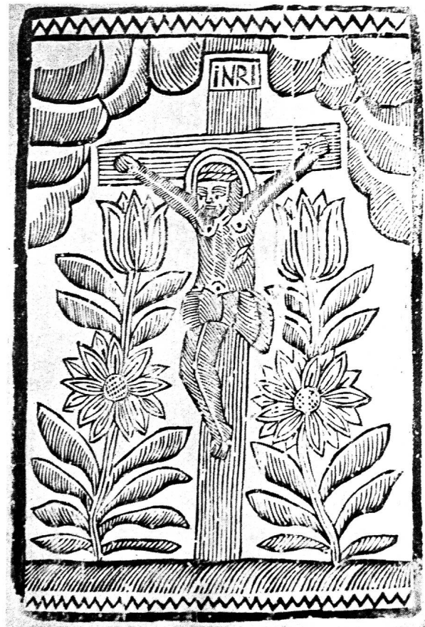
Bäurische Holzschnitte als beliebte Vorlagen für Hinterglasbilder mit Kreuzigung und Wallfahrtsmadonna. Böh- mische Volkskunst um 1800.