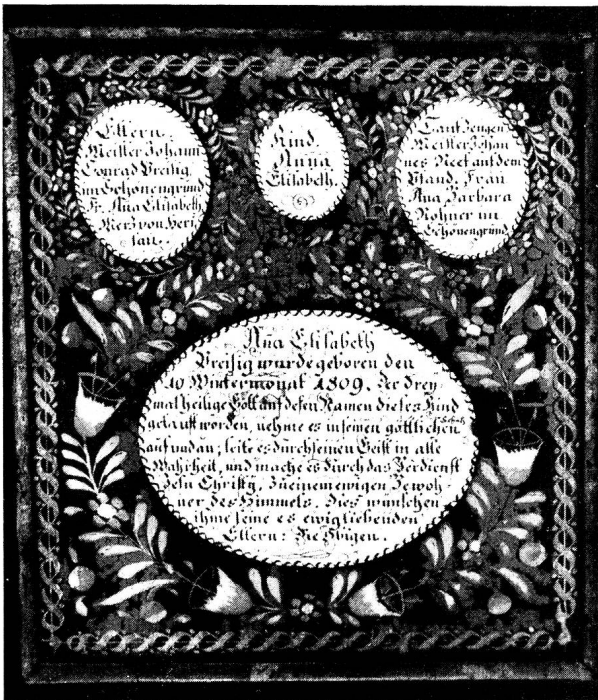
Toggenburger Tauftäfel in Hinterglasmanier mit zierlicher Blumenornamentik, vermutlich aus der Hand eines Wandermalers 1809 (Toggenburgisches Heimatmuseum Lichtensteig).