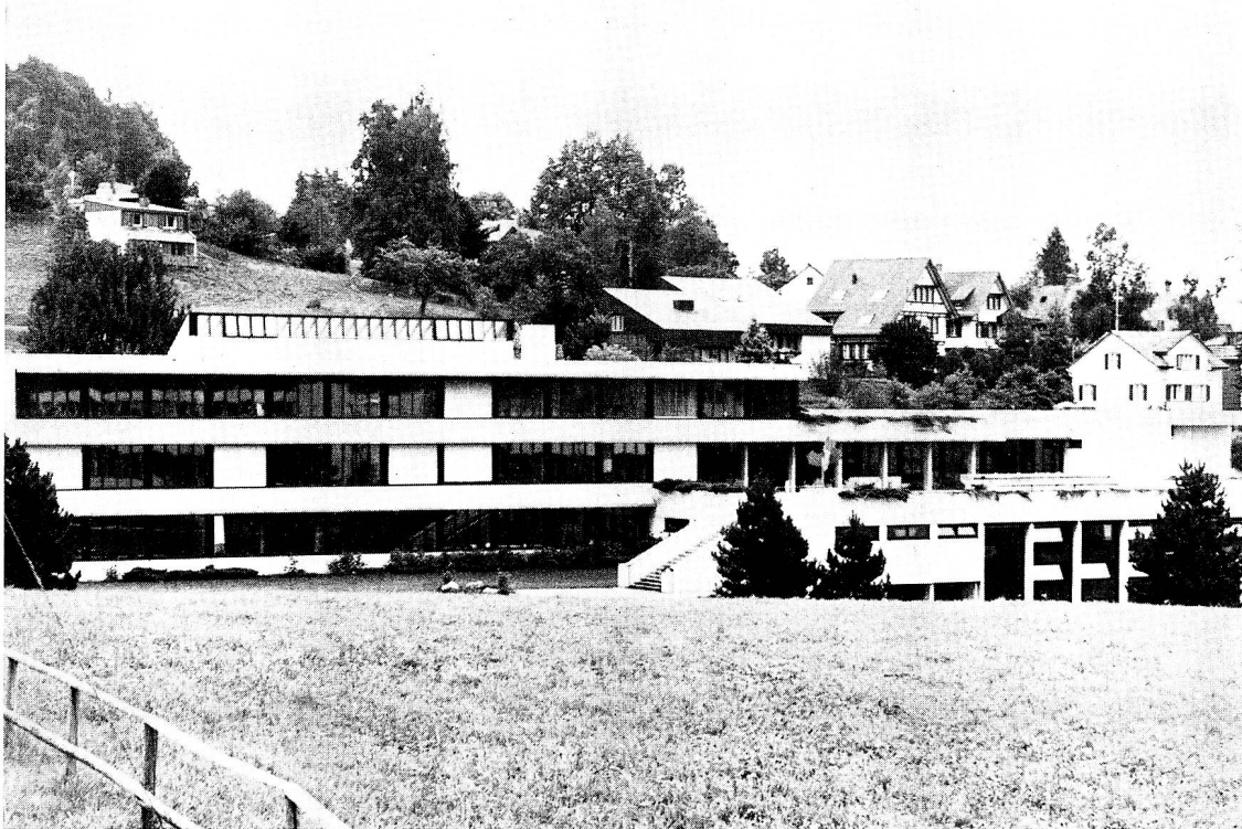
Die Errichtung der Degersheimer Oberstufenschulanlage war vor 15 Jahren eine Pioniertat, bestand doch bis zu diesem Zeitpunkt im ganzen Kanton kein Konzept für eine derartige Baute.

der Souverän den Gemeinderat, das Projekt Hafner & Räber weiter zu verfolgen, denn es sei in Bezug auf Gestaltung und Zweckmässigkeit vorteilhafter und günstiger. Knapp vier Monate später beauftragte die Bürgerschaft die beiden Zürcher Architekten mit der Detailprojektierung, verbunden mit einem gesamten Projektierungskredit von 88'000 Franken.