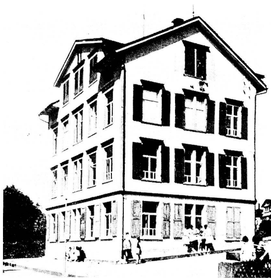
Von 1957 bis zur Eröffnung des Oberstufenschulhauses im Jahre 1973 besuchten die Sekundarschüler auch im ehemaligen katholischen Primarschulhaus (heutiger Parkplatz beim Friedhof) den Unterricht.

Die Beschaffung neuer Schulräume wurde in den fünfziger Jahren wieder besonders aktuell, da die evangelische Primarschule das an die Realschule vermietete Schulzimmer wegen Schaffung einer neuen Lehrstelle nun selber benötigte. Drei Varianten wurden zur Lösung dieser Probleme eingehend studiert: