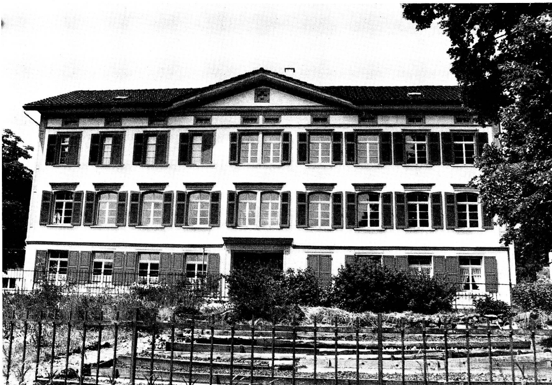
Während Jahrzehnten diente das ehemalige evangelische Primarschulhaus der Degersheimer Sekundarschule.

Die Annahme betreffend Schülerzahl sollte sich jedoch nicht bewahrheiten, denn bereits im Jahre 1897 stieg diese wiederum auf 38 Kinder an. Schulbänke waren aber nur für 35 Buben und Mädchen vorhanden und da der Schulrat diese Zahl in Anbetracht der Raumverhältnisse als Maximum betrachtete, wurden die schwächsten drei Schüler abgewiesen und die Schule mit 35 Schülern geführt. Aber der Platzmangel machte sich je länger je mehr fühlbar. Mit dem Beschluss, nochmals zwei Schulbänke anzuschaffen und diese in das ohnehin viel zu kleine Schulzimmer durch ein weiteres Zusammenrücken der alten Bänke hineinzuzwängen, konnten im Schuljahr 1902/03 39 Schüler unterrichtet