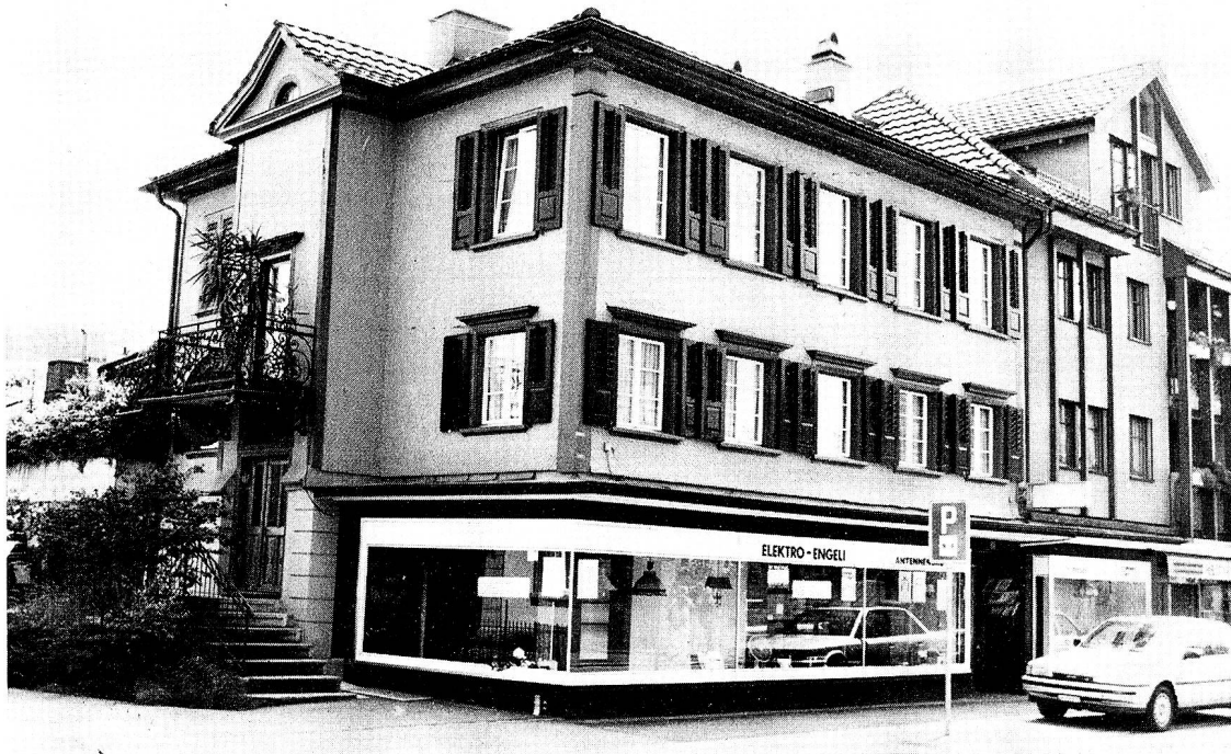
Im damaligen katholischen Schulhaus (heute Elektro Engeli) wurde im Mai 1864 die als Aktiengesellschaft geführte Realschule eröffnet.