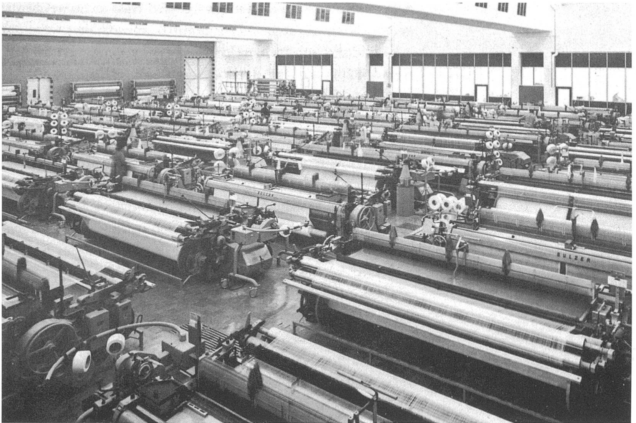
Weberei in Bütschwil. Erste Bauetappe mit 66 Sulzer-Webmaschinen (eingrichtet 1972).