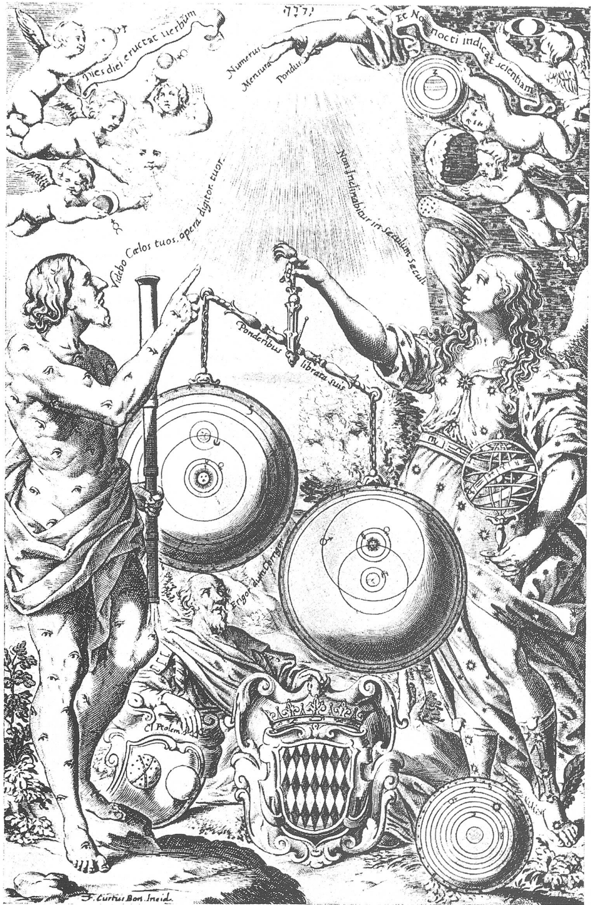
Titelbild zu J. B. Riccioli «Almagestum novum», Bologna 1651, darstellend das Übergewicht des braheschen Weltgebäudes gegenüber dem kopernikanischen (Zinner 1943, S. 377).